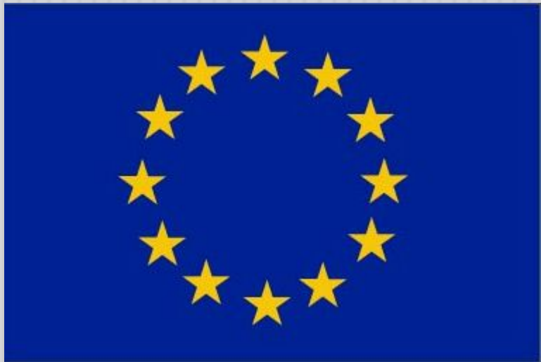
Флаг Европейского Союза

Политический и экономический союз стран Западной Европы