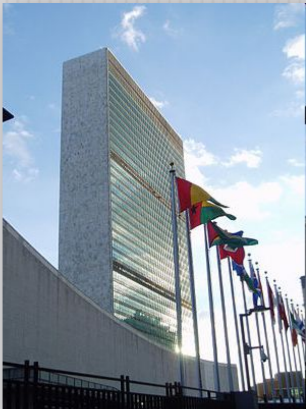
Здание штаб-квартиры ООН в Нью-Йорке

Международная организация, созданная для поддержания и укрепления международного мира и безопасности, развития сотрудничества между государствами