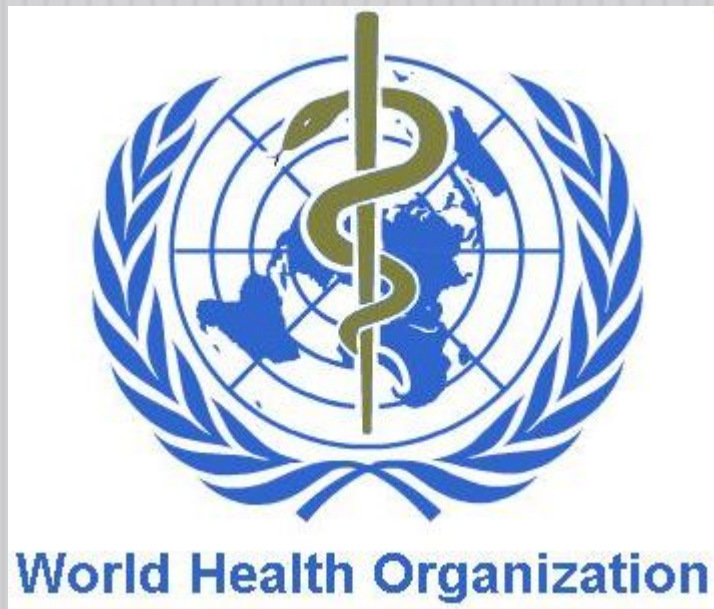
Логотип Всемирной организации здравоохранения

Специальное учреждение ООН, состоящее из 193 государств.