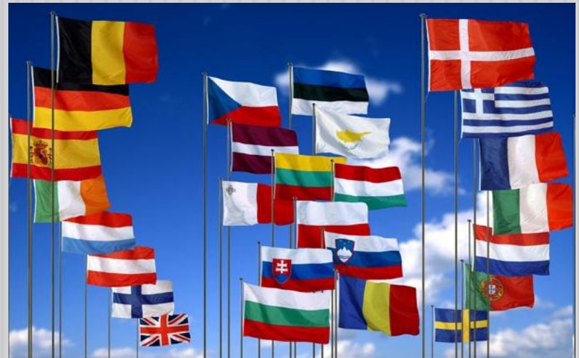
Флаги 27 государств – членов ЕС