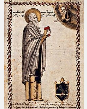
Матфей Властарь — известный византийский канонист, иеромонах из города Салоники.

Таким образом, иерархия правовых норм такова: писаный закон, обычай и судебный прецедент, аналогия с существующим законом, мнения авторитетных канонистов. Но высшим критерием, разумеется, являются нормы, непосредственно исходящие из Первоисточника церковного права – Божественной воли.