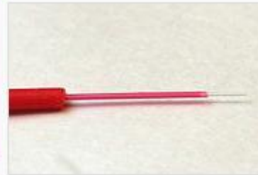
Нитка одномодового волокна