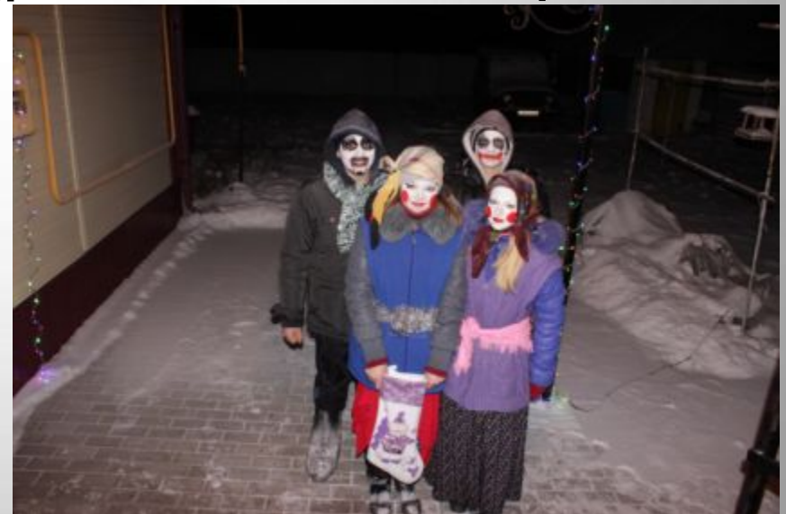
Обычаи, традиции, ритуалы, обряды