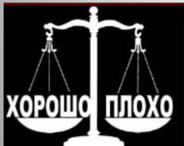
Нормы морали (нравственности)