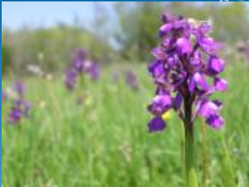
Orchis morio L.

Із відомих науці 85 видів роду зозулинців на Україні зустрічається 17. Деякі з них ростуть і на Хмельниччині. Зозулинець салеповий росте на луках, лісових полянах, узліссях. Як декоративна рослина він був випробуваний в культурі в ботсадах Києва, Ялти. Причиною зменшення кількості рослини є складна біологія розвитку. У насінні орхідей немає ніяких запасних поживних речовин і для проростання їх в ґрунті їм необхідний симбіоз з мікоризою гриба. Там, де немає грибів чи їх мало, орхідеї зникають. А наявність грибів залежить в свою чергу від методів і характеру використання ґрунтів. Російська назва рослини "ятрышник" залежить від форми її бульбачок "ятрышник" від "ятро", "ядро", тобто кругловаті.