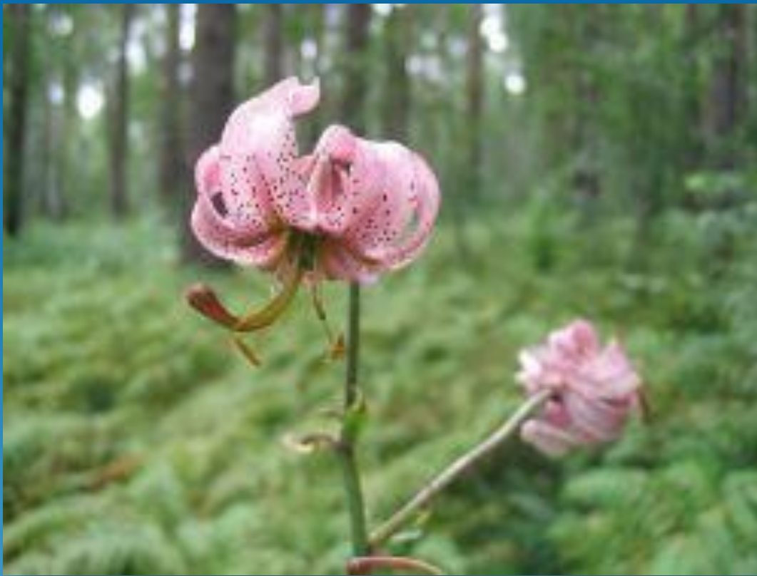
Lilium martagon L.

Єдиний дикорослий представник лілій у нашій флорі. В народі має різні назви: лілія, вороняче масло, маслянка, масляночкатощо. Це – декоративна рослина. Квіти мають своєрідний, трохи різкий аромат, причому, ввечері і вночі аромат сильніший. Запилюються квіти нічними метеликами з довгим хоботком. Цибулини їстівні, на смак солодкуваті, нагадують каштан. В Сибіру їх пекли або варили з молоком і маслом, а в Киргизії добавляли до овечого жиру. За будовою цибулина дуже цікава. Дно цибулини має корінчики, які в холодну пору скорочуються, втягуючи цибулину глибше в землю. Розмножується насінням та вегетативно-дочірніми цибулинками. Росте лілія лісова в лісах, на узліссях, серед чагарників. Причини зміни чисельності – зривання на букети, викопування цибулин, зникає також під час вирубування лісів.