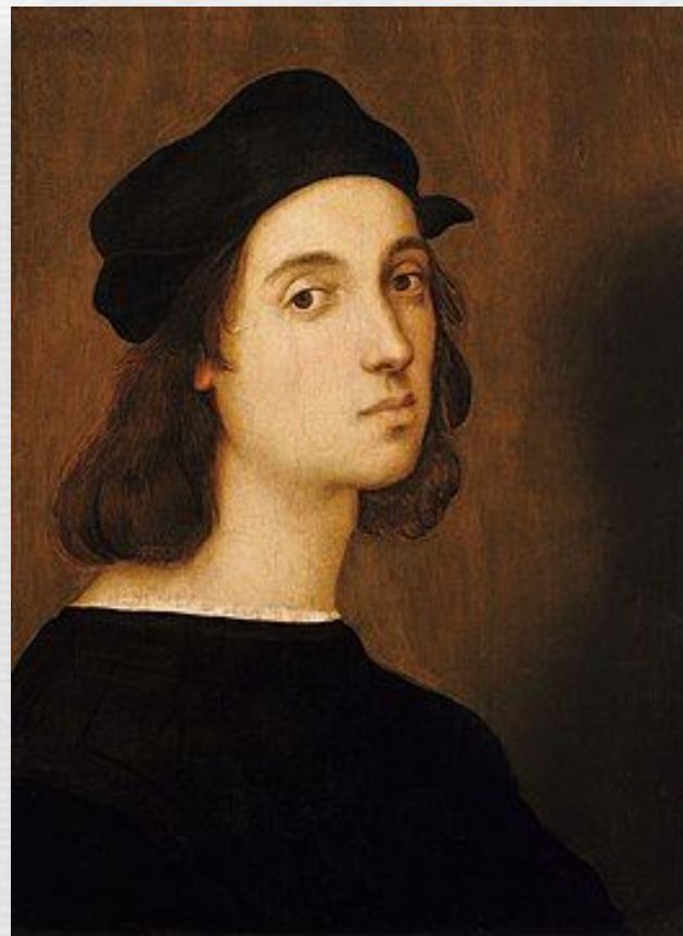
Рафаель Санті Автопо ртрет