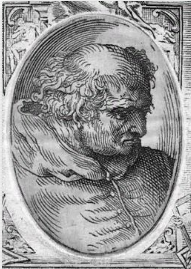
Портрет Браманте в книзі Дж. Вазарі

Браманте прийняв виклик, але так і не зміг побачити результати своєї роботи – через декілька років від початку він помер. Його замінив Рафаель Санті.