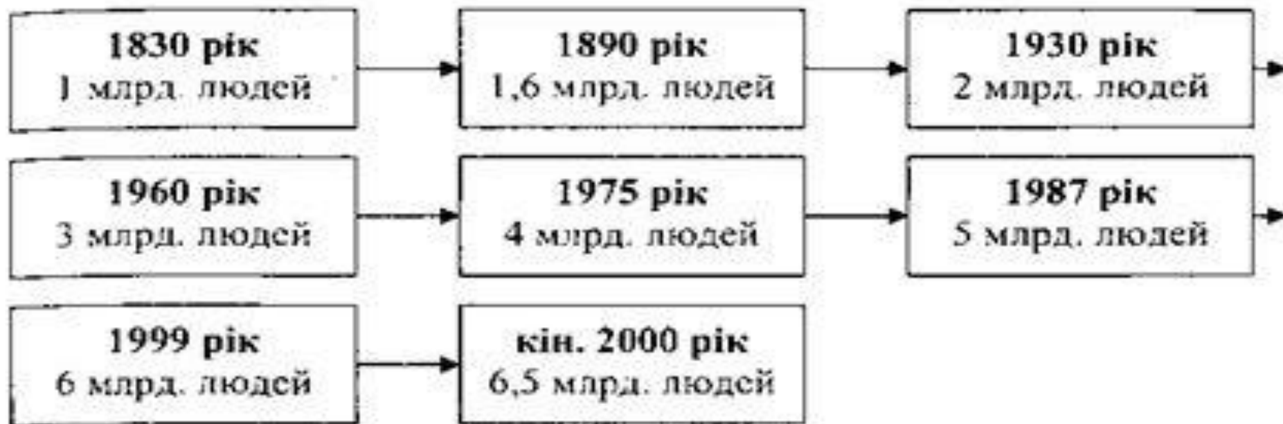
Рис. 1.22. Зміна чисельності населення Землі протягом XIX-XX століть.

Питання демографічних процесів стали у центрі уваги діяльності багатьох міжнародних організацій, у тому числі й Організації Об'єднаних Націй, яка віднесла ці питання до числа глобальних проблем сучасності