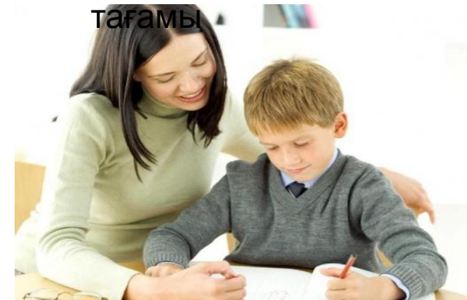
Мұғаліммен жеке оқу