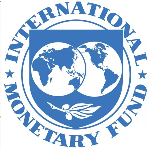
Международный валютный фонд