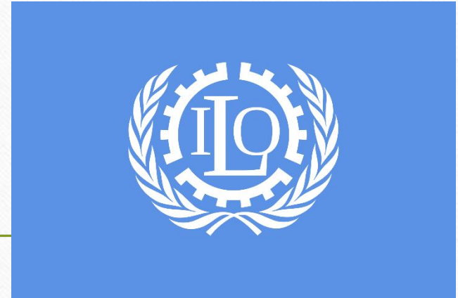
Международная организация труда