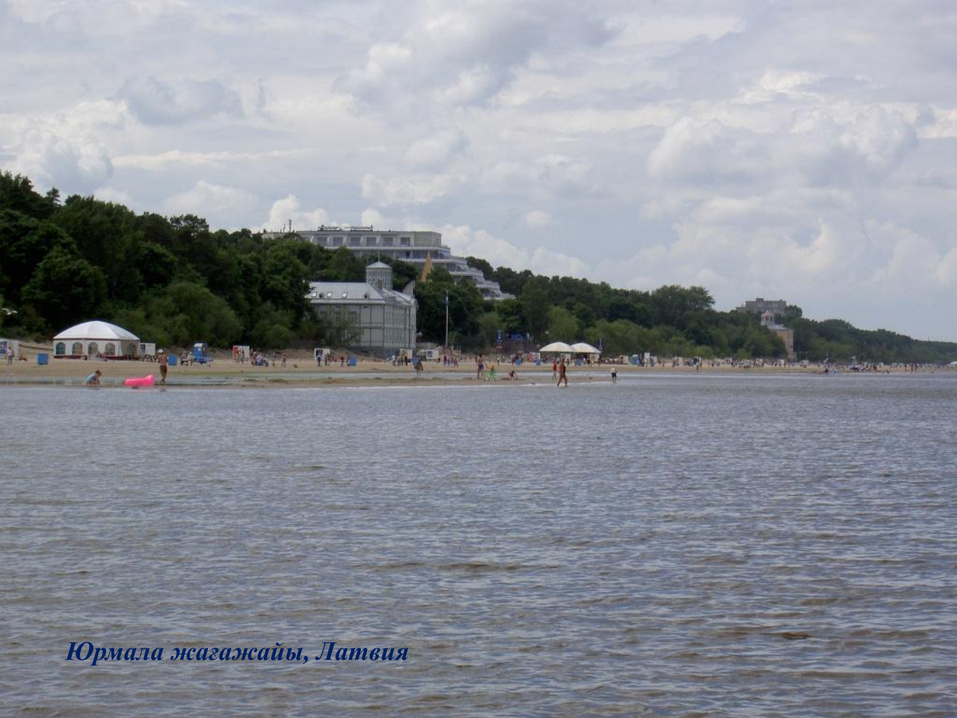
Юрмала жагажсайы, Латвия