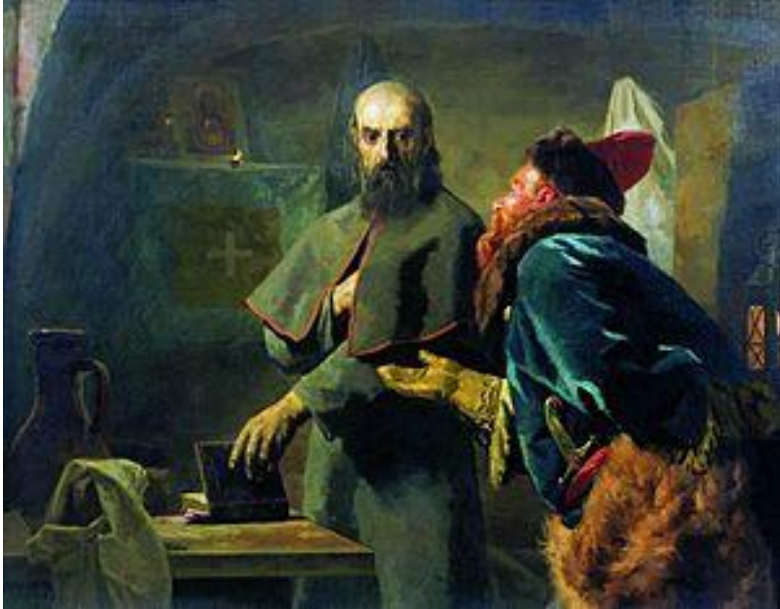
Малюта Скуратов и митрополит Филипп.