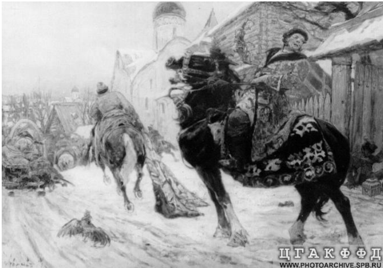
Михаил Авилов, "Опричники в Новгороде"