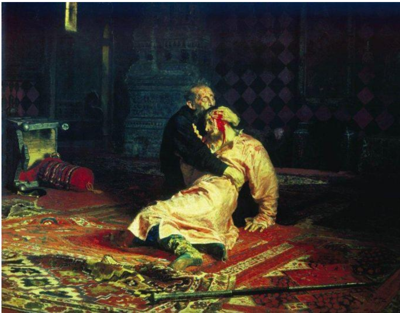
Илья Репин «Иван Грозный и сын его Иван 16 ноября 1581 года»