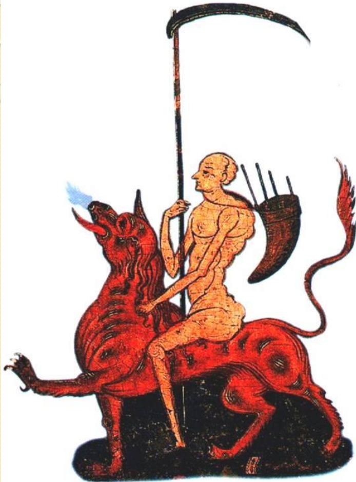
Черт-опричник. Миниатюра 16 в.

Несмотря на официальную отмену опричнины, массовые казни продолжались.