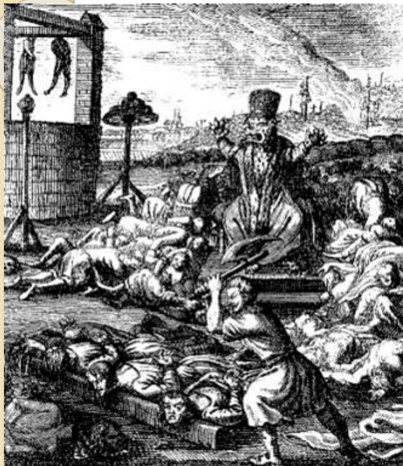
И. Грозный на престоле. Немецкая гравюра. 1725 г.

Бояре, спасаясь от царского гнева бежали за границу. Андрей Курбский, бежавший в Литву, призвал Грозного прекратить казни. В ответном послании царь заявил о готовности защищать неограниченную царскую власть и вскоре приступил к ликвидации самостоятельности бояр.