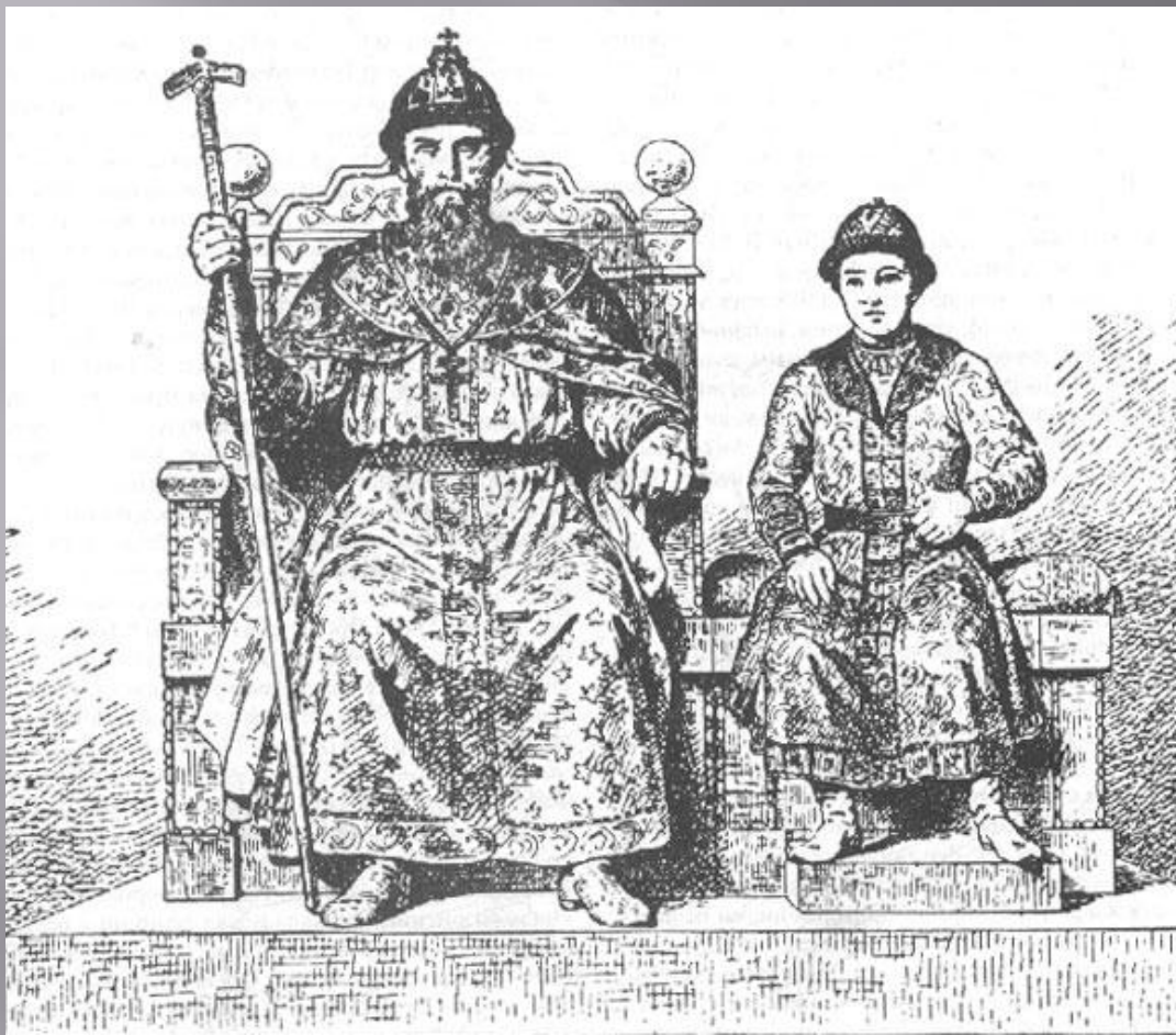
«Василий II Темный и его сын Иван». Неизвестный автор.

В восьмилетнем возрасте Иван III был провозглашён своим отцом Василием II (по прозвищу Тёмный) великим князем и соправителем отца.