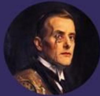
Джозеф Остин Чемберлен

«Теперь, с образованием мощных союзов, Англия должна искать себе друзей... Война, конечно, ужасна. Но война без союзников невыносима...»