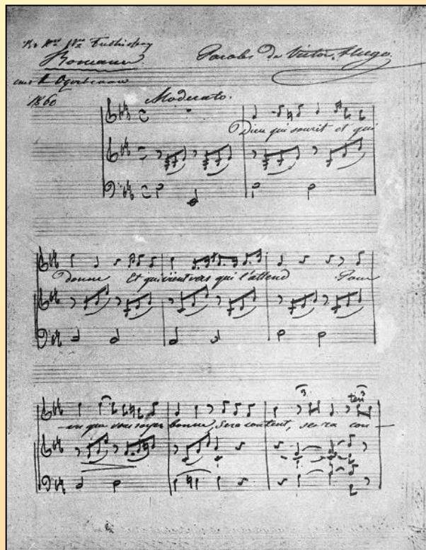
Рукопись первой страницы одного из романсов Даргомыжского