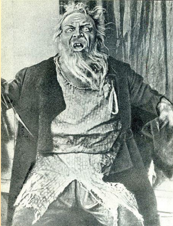
Ф. И. Шаляпин в роли Мельника в «Русалке»