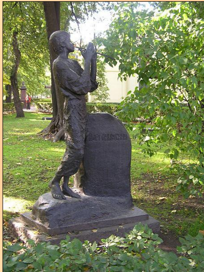
Памятник на могиле А. С. Даргомыжского на Тихвинском кладбище Александро-Невской лавры (Санкт-Петербург)