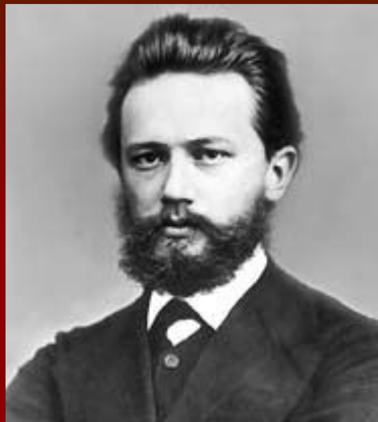
Петр Ильич Чайковский в 1869 году. Фотография.

Именем Чайковского названы (1940) Московская и Киевская консерватории, концертный зал в Москве; с 1958 в Москве каждые 4 года проводится Международный конкурс имени Чайковского.