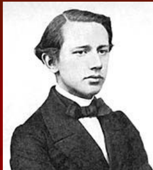
Петр Чайковский в 1860-е годы. Фотография.

Лишь в 1861 Чайковский приступил к серьезным занятиям в музыкальных классах Петербургского отделения Русского музыкального общества. Осенью 1862 он стал студентом преобразованной из музыкальных классов Петербургской консерватории, которую с отличием окончил в 1865 по классам А. Г. Рубинштейна, высоко ценившего талант ученика, и Н. И. Зарембы. Тогда же были написаны первые крупные сочинения для симфонического оркестра: увертюра «Гроза» (к драме А. Н. Островского, 1864) и Увертюра фа-мажор (1865), «Характерные танцы», кантата для солистов, хора и оркестра на оду Шиллера «К радости» (дипломная работа), камерные произведения. Оставив службу в мае 1863, зарабатывал на жизнь уроками.