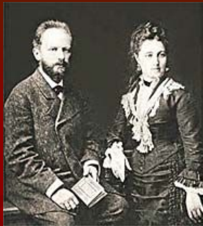
П. И. Чайковский с женой.

Личная жизнь композитора не складывалась. В 1877 он женился на А. И. Милюковой. Брак этот оказался крайне несчастливый; связанные с ним переживания чуть не довели Чайковского до самоубийства. В 1878 он фактически бежал из России и в течение нескольких лет жил преимущественно за границей (главным образом в Швейцарии и Италии).