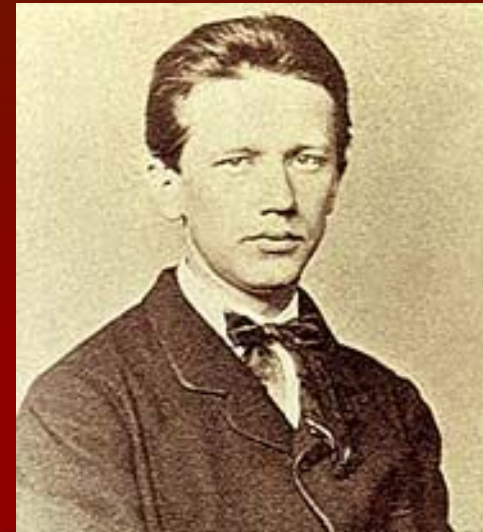
Петр Ильич Чайковский в 1862 году. Фотография.

утвердившая место Чайковского среди крупнейших симфонистов мира.