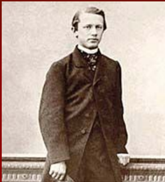
Петр Чайковский в 1859 году.