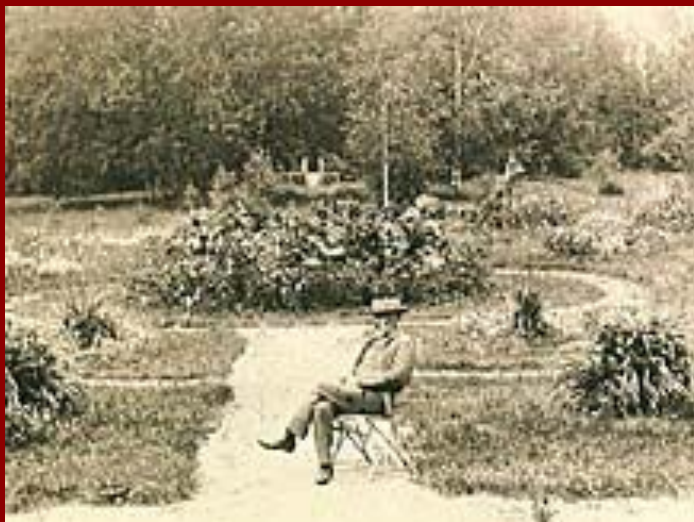
Петр Ильич Чайковский во Фроловском

Во второй половине 1880-х начинается дирижерская деятельность Чайковского — сначала в России, а потом за границей; в качестве исполнителя собственных произведений он посещает Германию, Австро-Венгрию, Францию, Англию, Швейцарию. Концертные поездки укрепили его творческие и дружеские связи с ведущими музыкантами эпохи, в том числе с Э. Григом, А. Дворжаком, Г. фон Бюловом. Зимы композитор проводит, как правило, за границей, лето — в основном на родине.