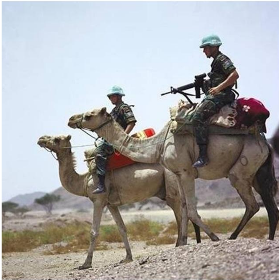
«Голубые каски» в Сирии.