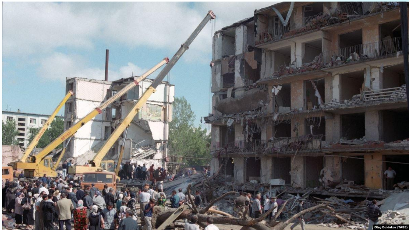
теракт в Буйнакске 1999 г.