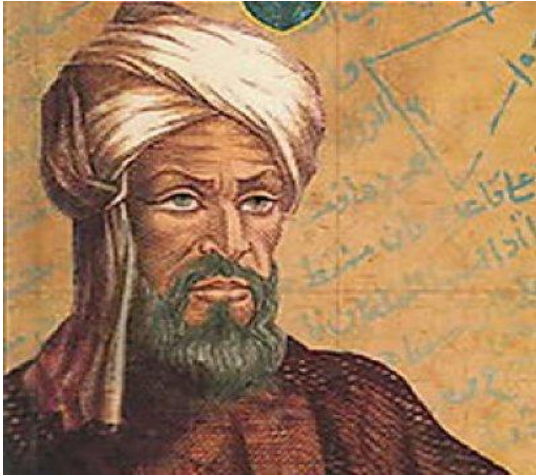
Реванди әл - Хорезми