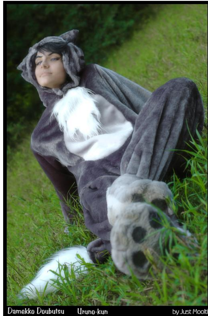
Damekko Doubutsu Uruno-kun by Just Moolti