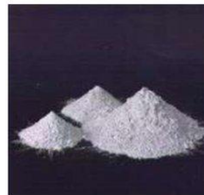
Вяжущее Каустический доломит