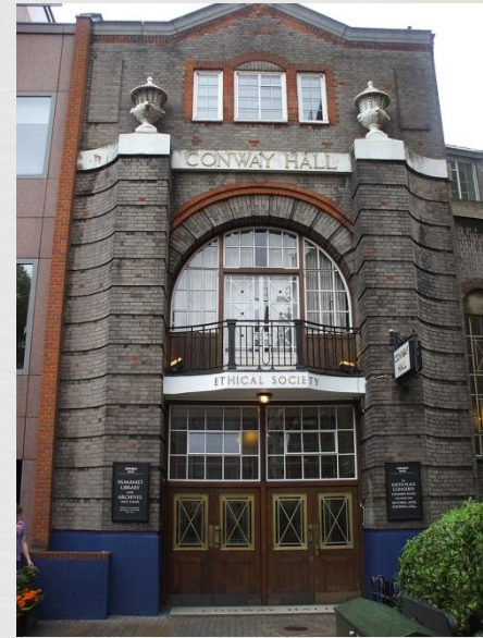
Будівля Conway Hall