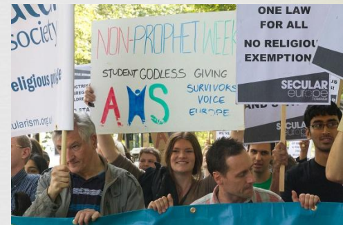
Марш за світську Європу 2012 р.

Згідно з веб-сайту AHS, вони мають бачення «процвітаючої атеїстичної, гуманістичної або світської студентської спільноти у кожному інституті вищої освіти у Великобританії та Республіці Ірландія». Вони сприяють утвердженні цього, проводячи різноманітні заходи, надаючи корисну інформацію суспільству та представляючись на національному та міжнародному рівнях.