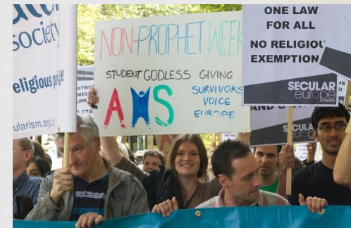
Марш за світську Європу 2012 р.

Згідно з веб-сайту AHS, вони мають бачення «процвітаючої атеїстичної, гуманістичної або світської студентської спільноти у кожному інституті вищої освіти у Великобританії та Республіці Ірландія». Вони сприяють утвердженні цього, проводячи різноманітні заходи, надаючи корисну інформацію суспільству та представляючись на національному та міжнародному рівнях.