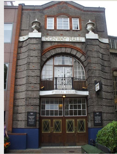
Будівля Conway Hall