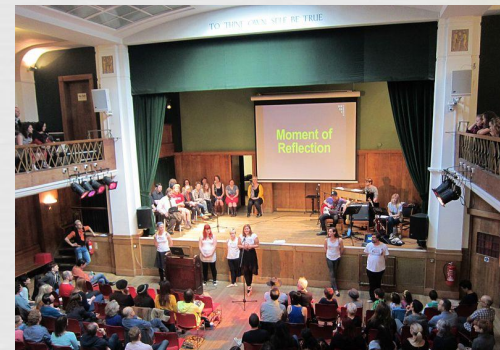
Асамблея у «Конвей Хол»

Недільна Асамблея є організацією нерелігійних зібрань, що була заснована у січні 2013 року. Метою зібрань є створення середовища спілкування для нерелігійних людей, але подібного до релігійного. Згодом організація зростає до 70 місцевих осередків по усьому світу в таких містах як Нью-Йорк, Пітсбург, Сан Дієго, Дублін. Зібрання відбуваються двічі на місяць й охоплюють більше 600 людей.