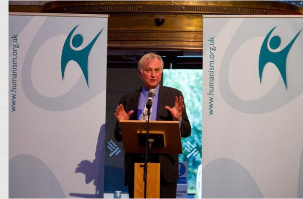
Річард Докінз отримує нагороду за «Служіння гуманізму» 2012 р.