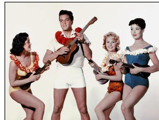
ГАВАЙСКИЕ ГИТАРЫ И ПЕСНИ