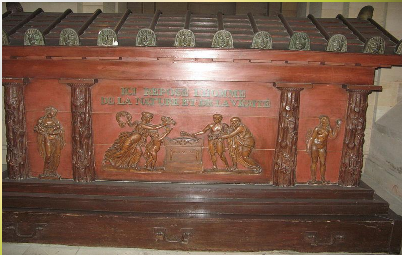
Надгробие Руссо в парижском Пантеоне