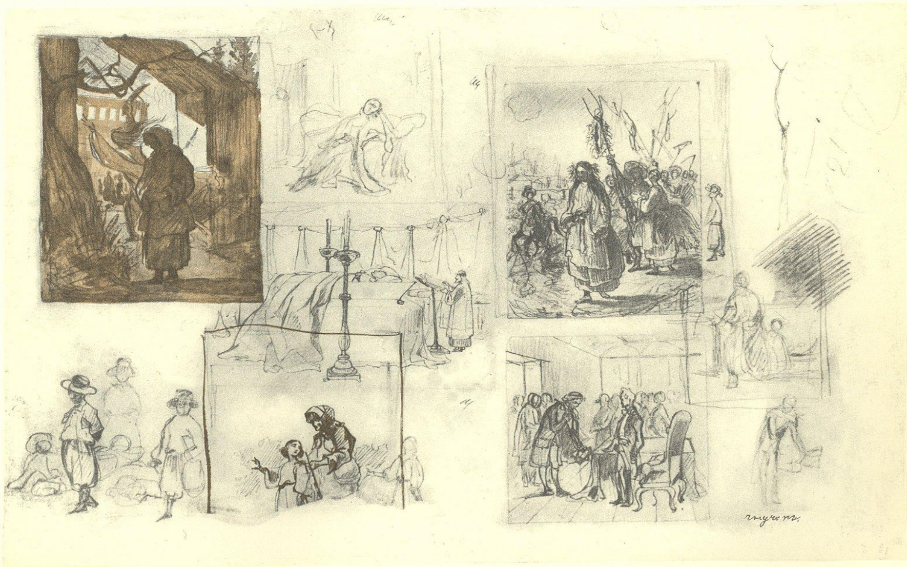
271. «СЛЕПАЯ», «ИСТОРИЯ СУВОРОВА». ЕСКІЗИ ТА НАЧЕРКИ. Олівець, сепія, туш. [1842].