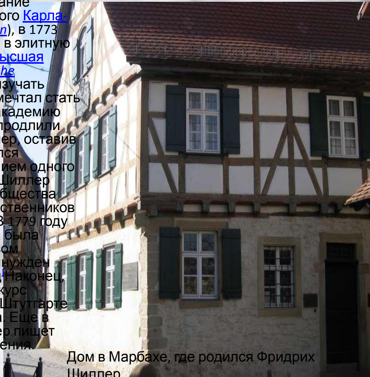
Дом в Марбахе, где родился Фридрих Шиллер