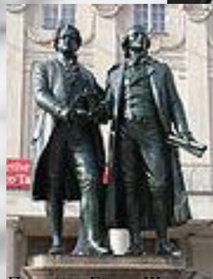
Памятник Гёте и Шиллеру у здания театра в Веймаре