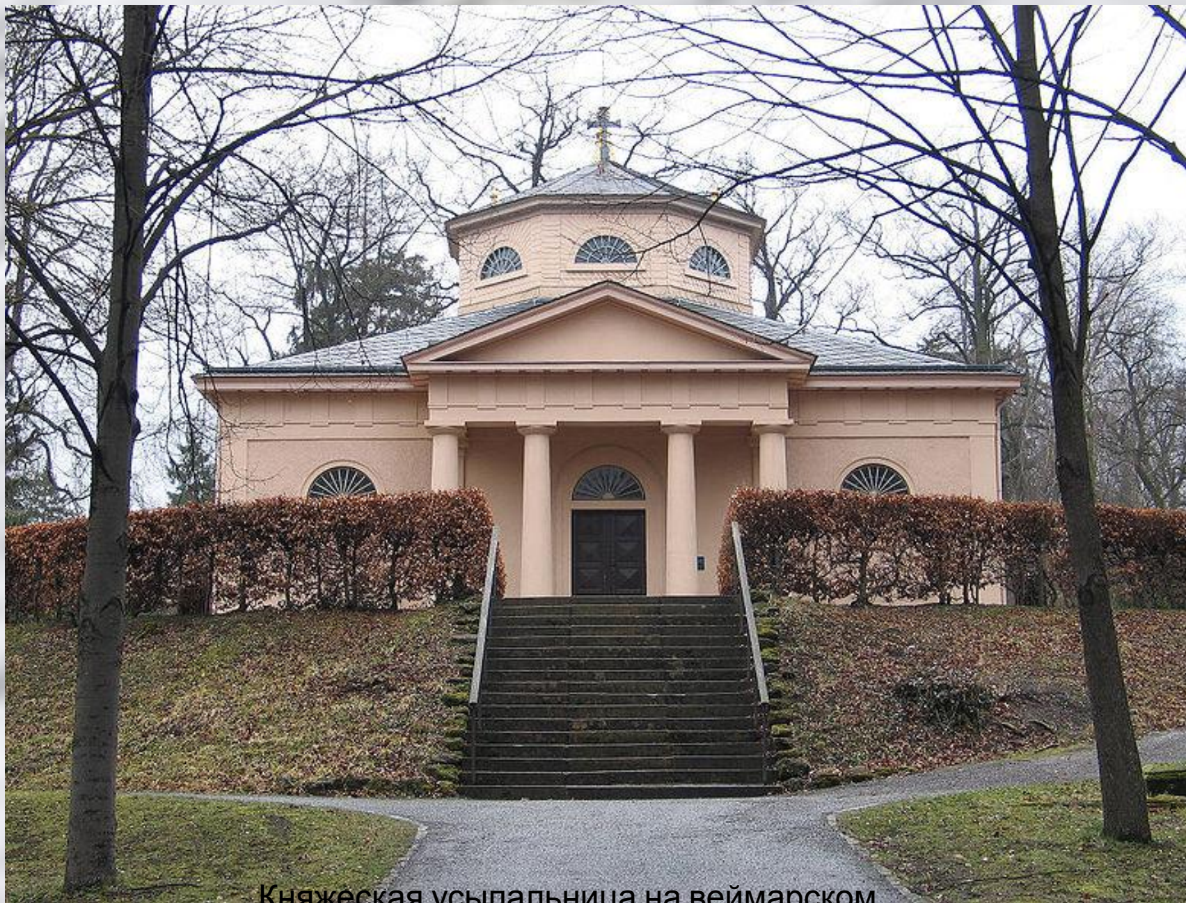
Княжеская усыпальница на веймарском кладбище, где похоронены Шиллер и