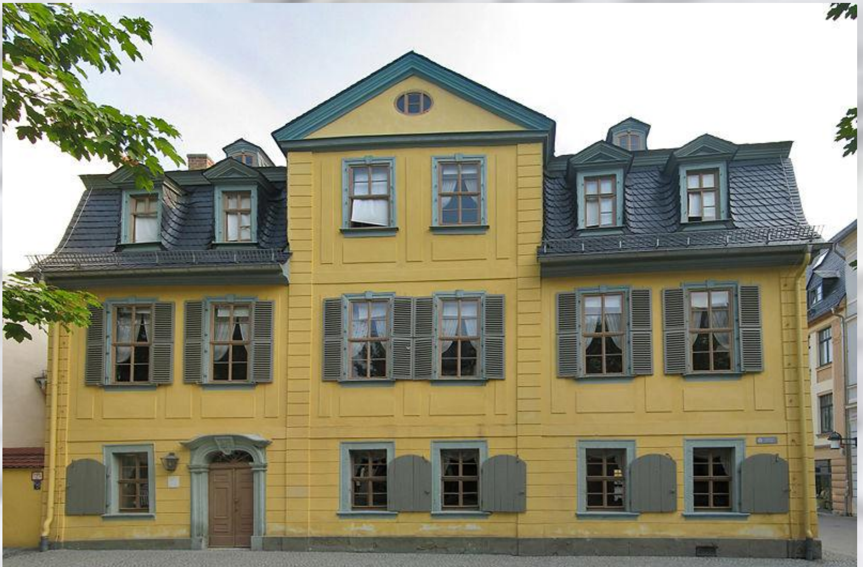
Дом Шиллера в Веймаре