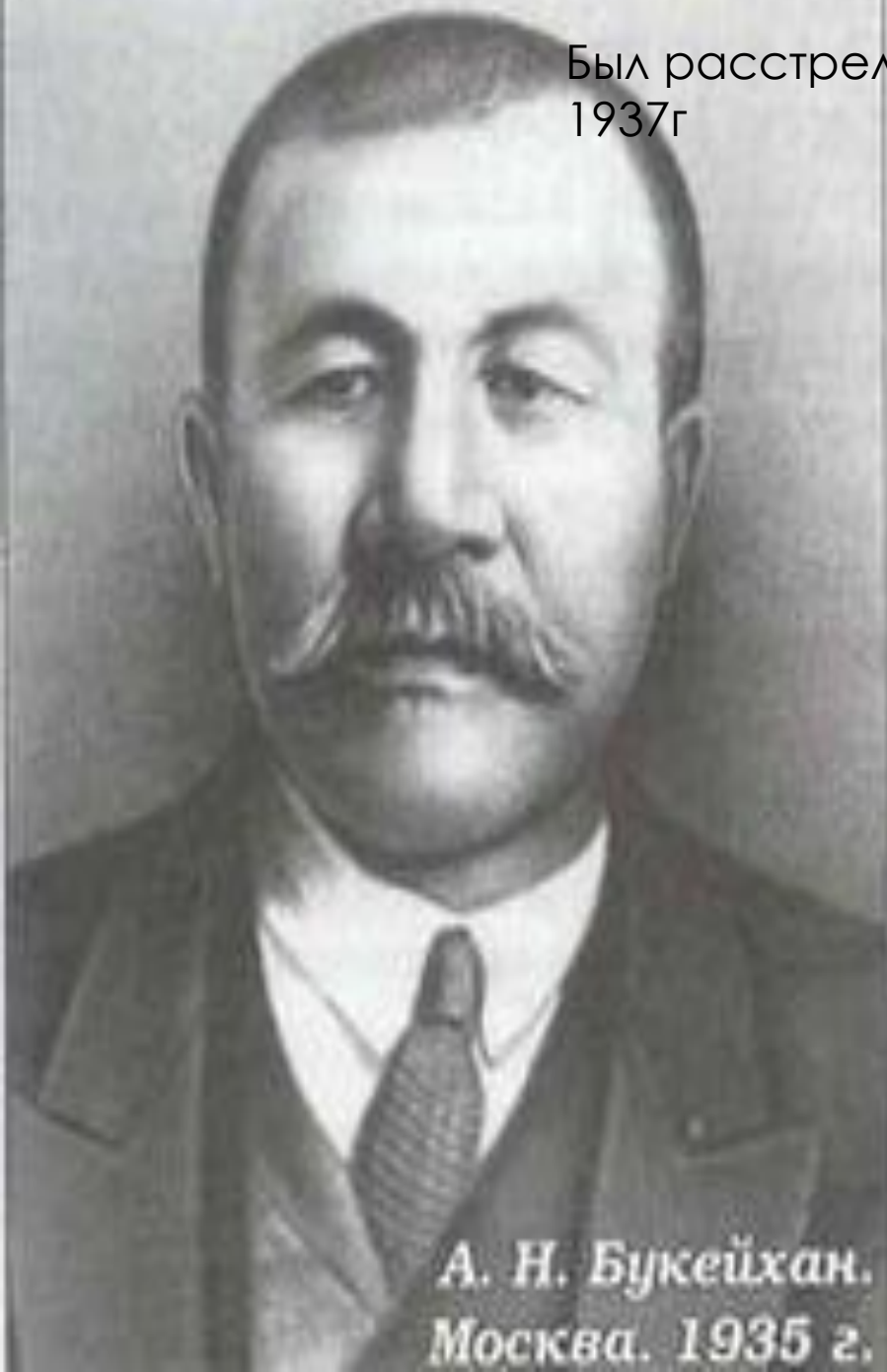
А. Н. Букейхан. Москва. 1935 г.