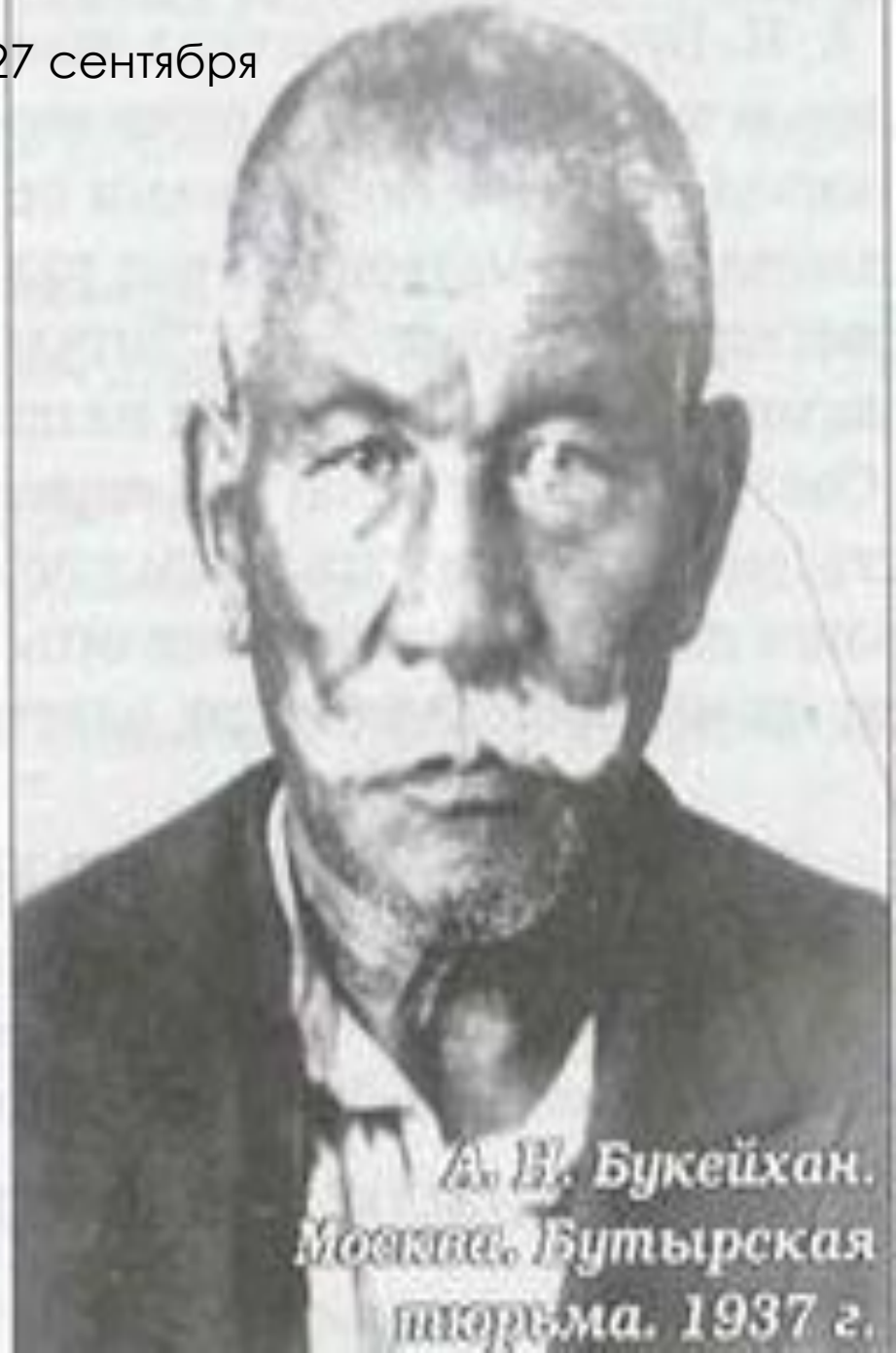
А. В. Букейхан. Москва, Бутырская тюрьма. 1937 г.