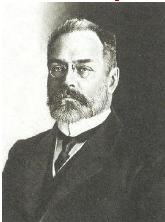
Александр Иванович Гучков

Весной 1915 г. были созданы Особые совещания по обороне, топливу, продовольствию и транспорту.