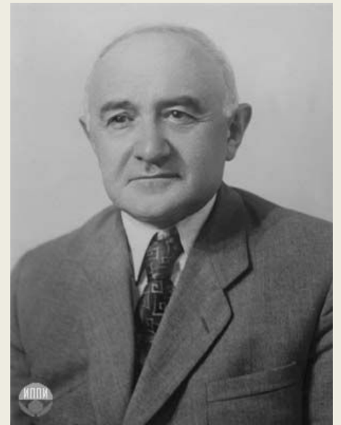
Рубен Иванович Аванесов