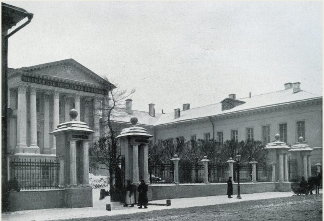
Научно-исследовательский институт языкознания