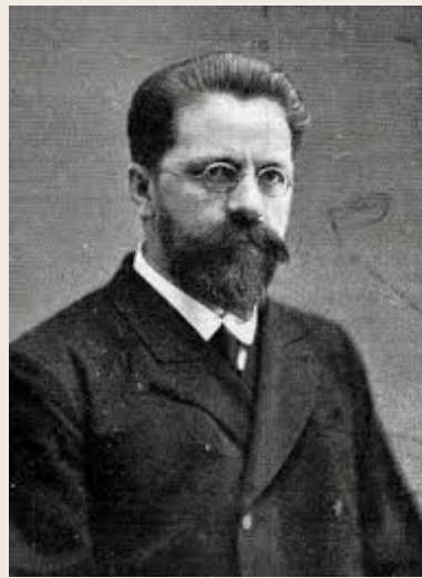
Александр Николаевич Реформатский