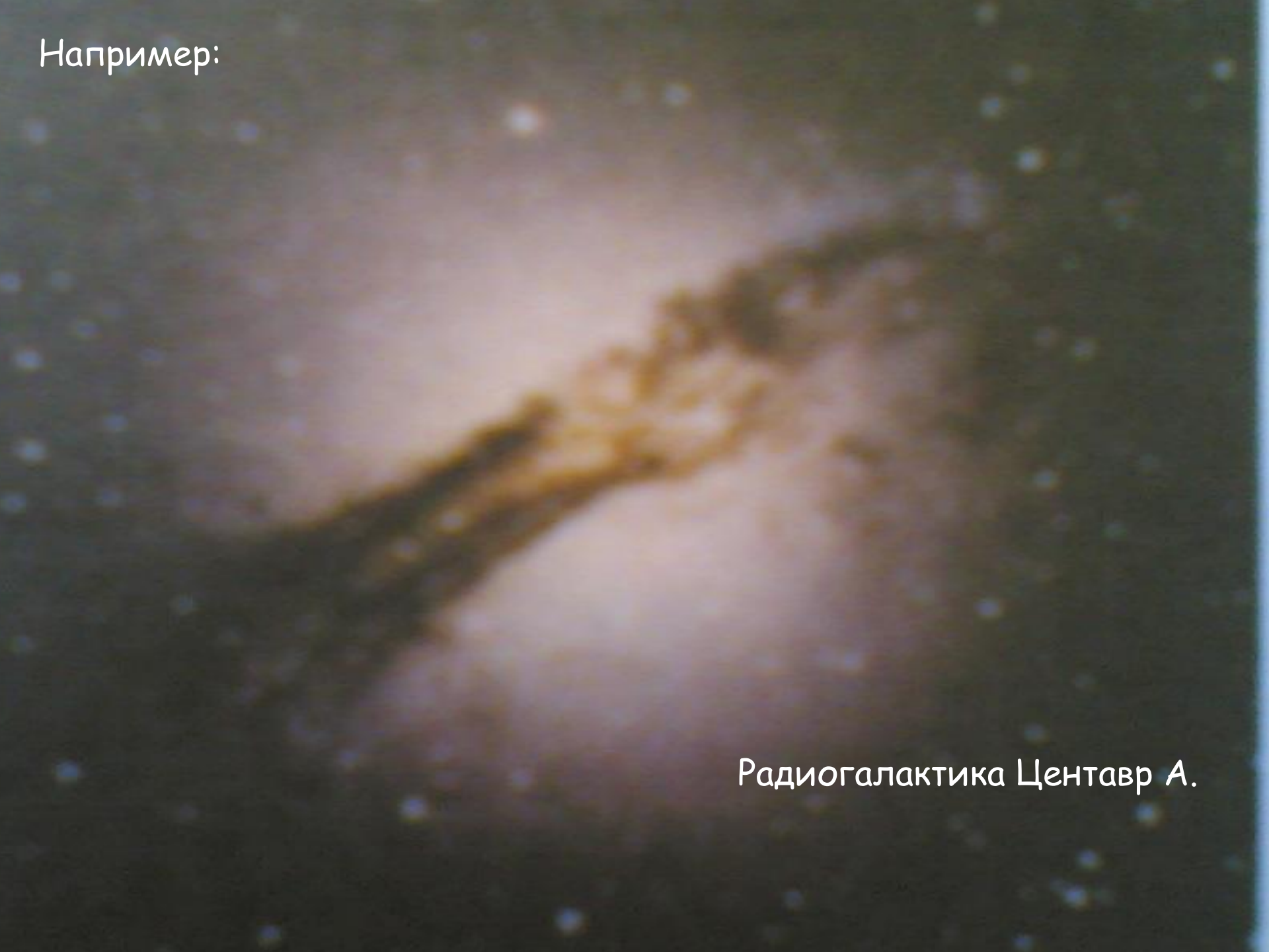
Радиогалактика Центавр А.