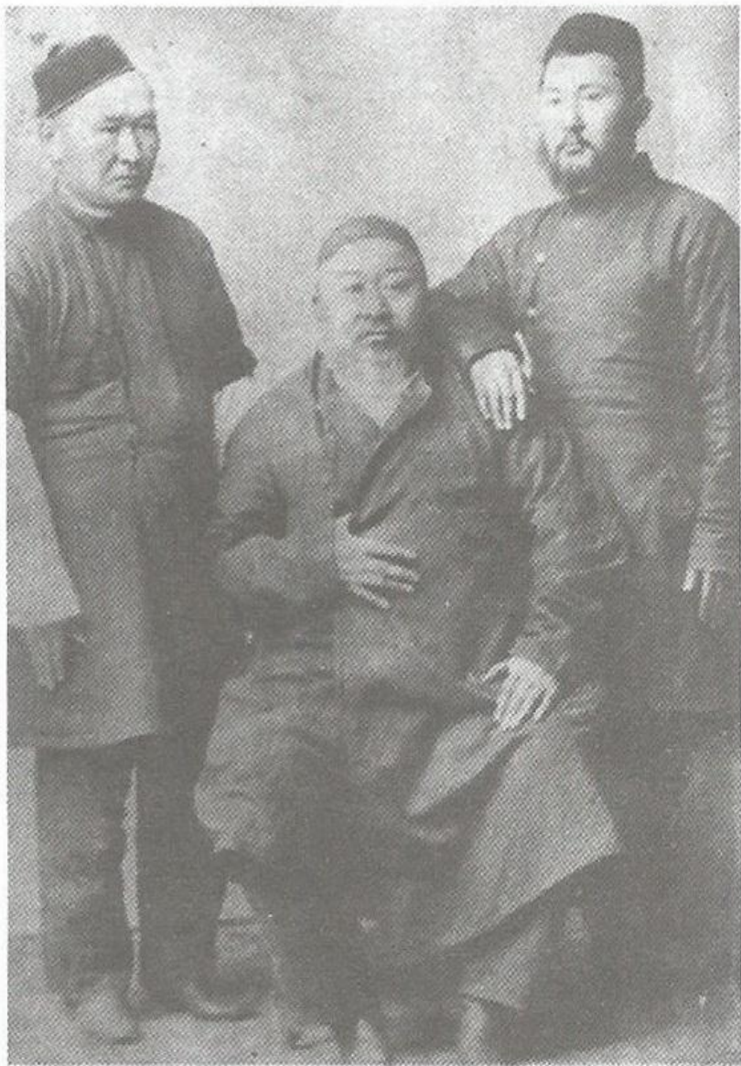
Абай және оның балалары Ақылбай (сол жақта) мен Тұрағұл