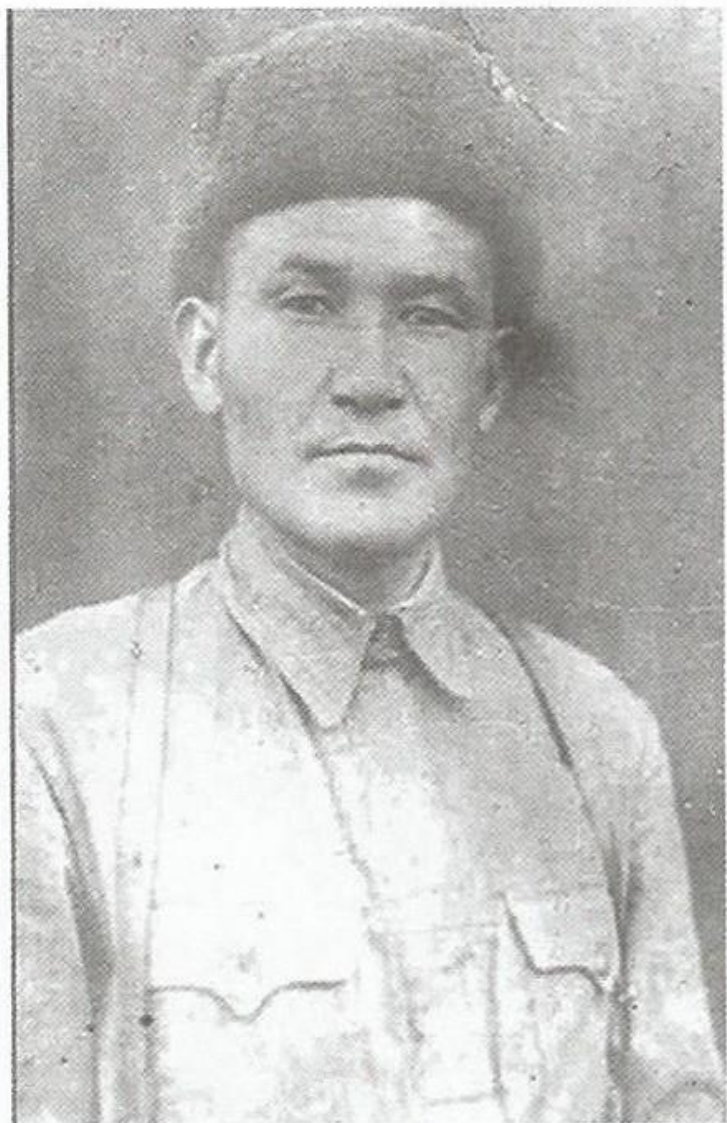
Құзайыр Мекайылұлы Абайдың немересі (1912–1945)