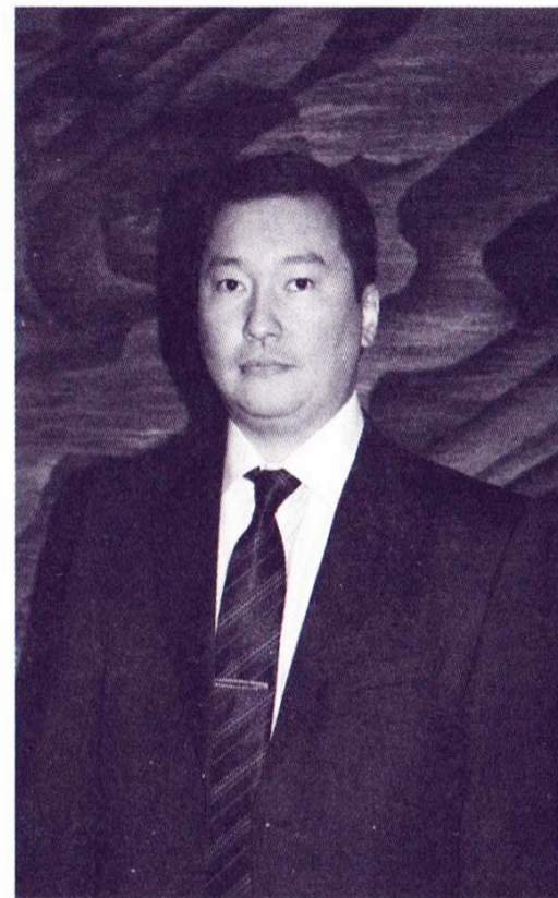
Данияр Айдарұлы Абайдың неменесі (1971)