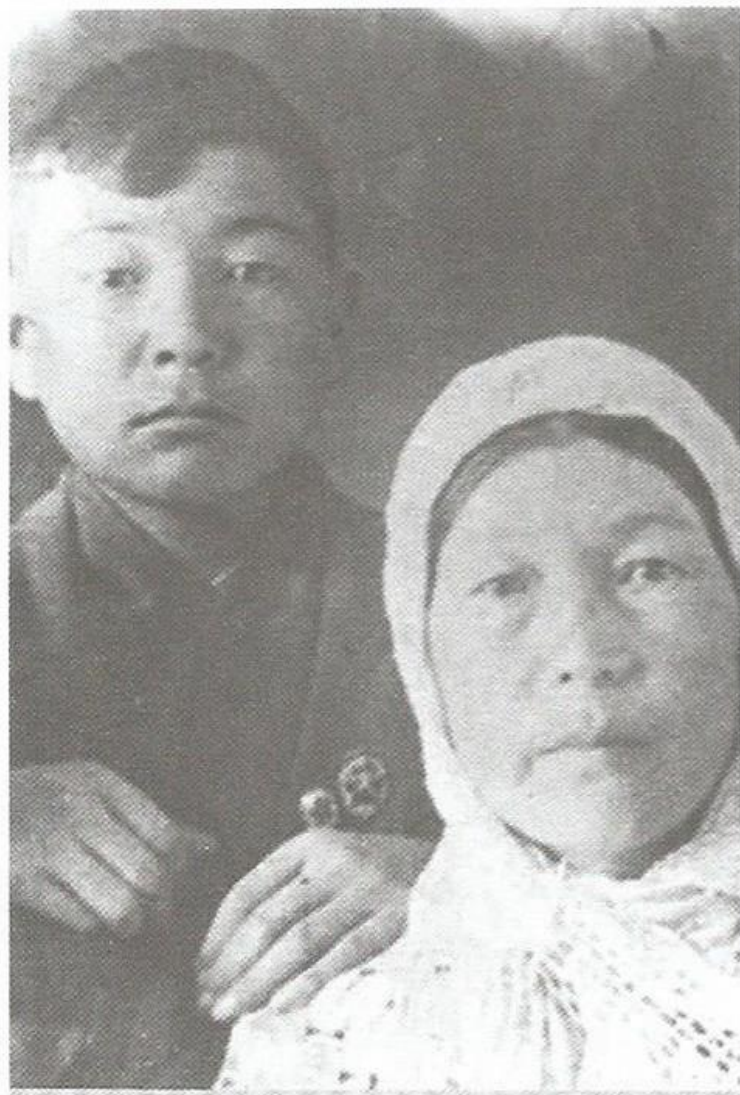
Тоқташ Ізқайлұлы Абайдың немересі (1924–1943)