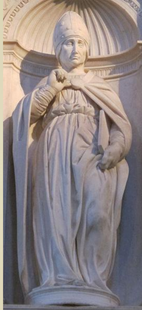
«Святой Пій I»