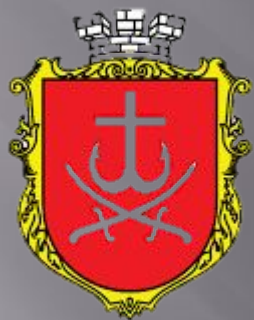
Середній герб Вінниці