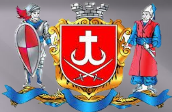
Великий Герб Вінниці