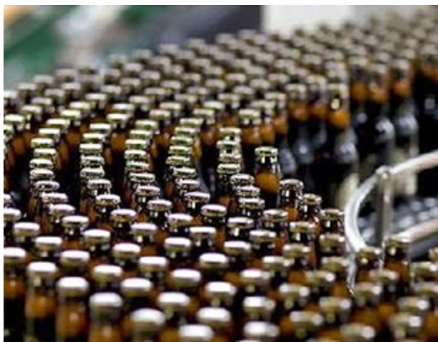
Фармацевтик а және дәрі жасау