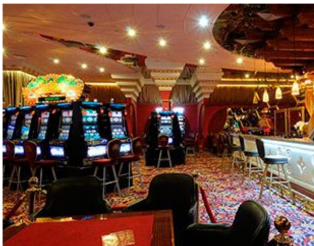
Қонақүйлік, мейрамханалық және ойын бизнесі