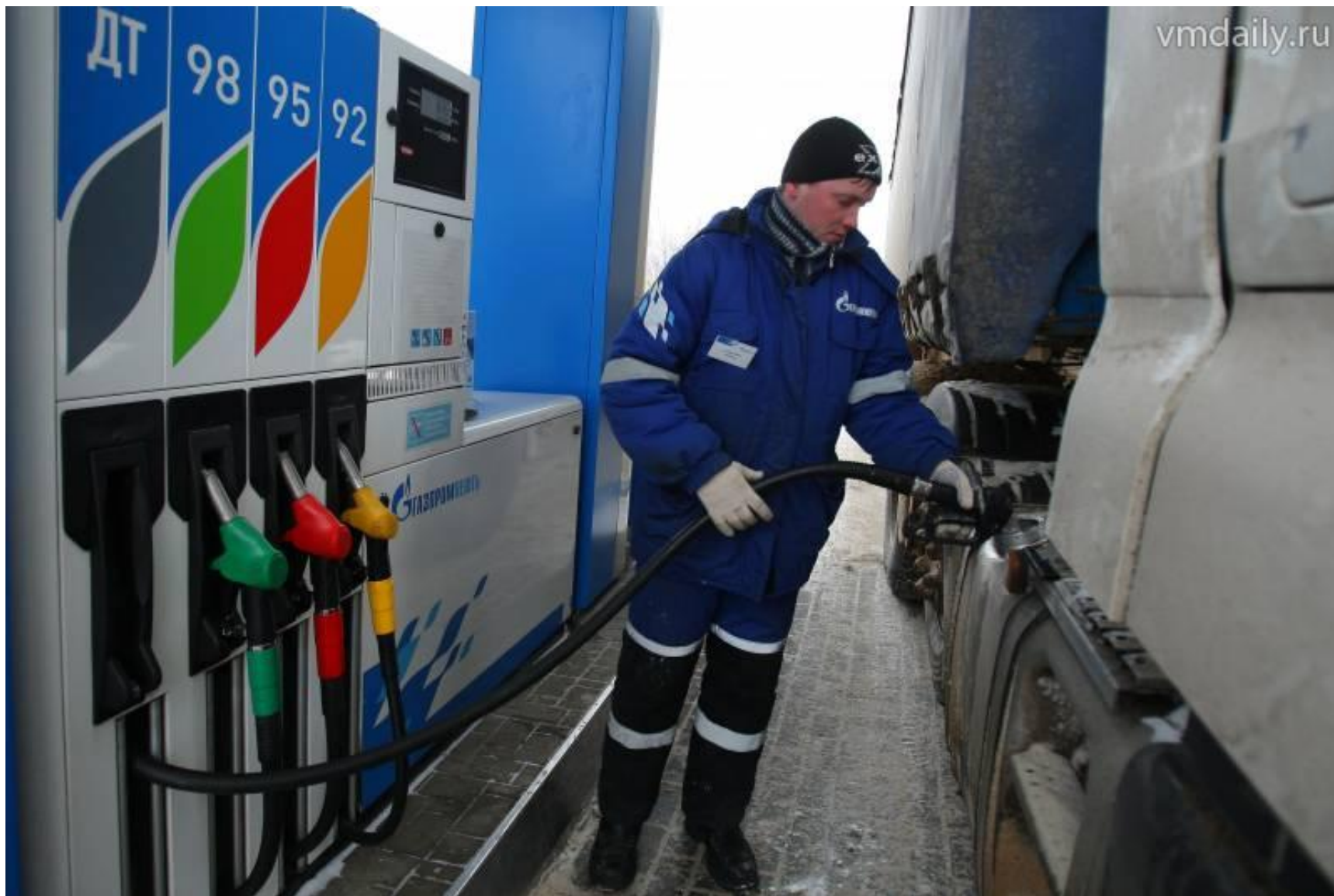
Многофункциональные смазочно-заправочные установки.