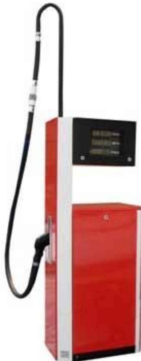
Стационарные колонки с электромеханическим приводом