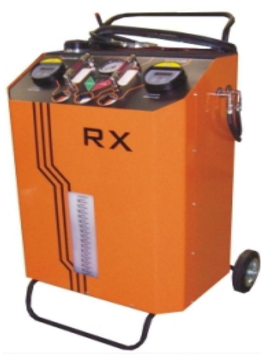
Оборудование для заправки тормозной жидкостью