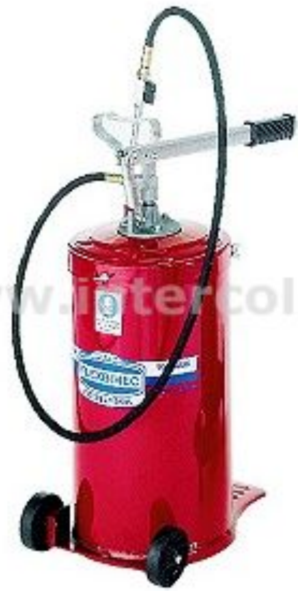
Переносные маслораздаточные колонки с ручным приводом