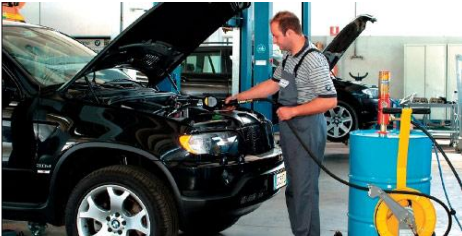
Заправка масла с переносной маслораздаточной колонки