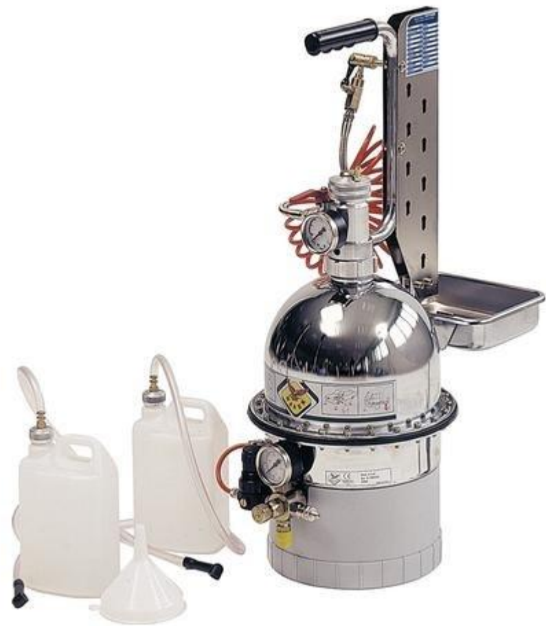
Оборудование для заливки и прокачки гидравлических тормозов автомобилей