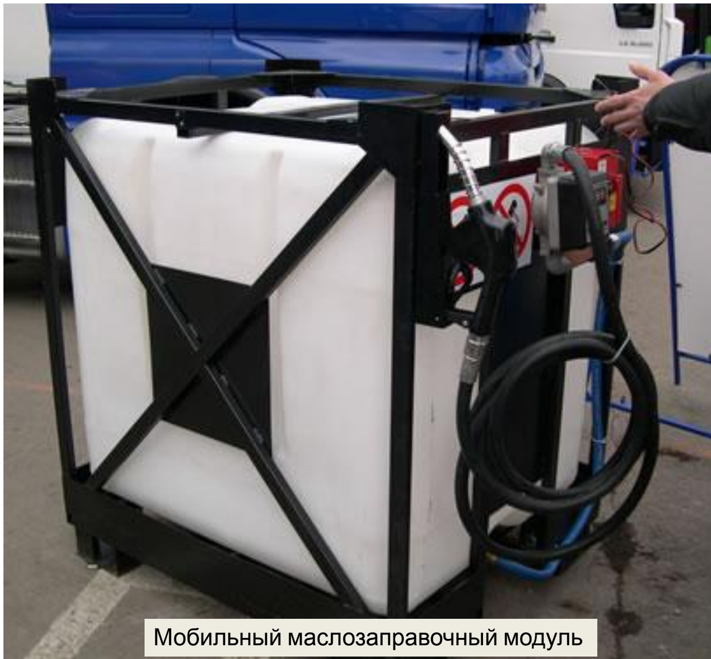
Мобильный маслозаправочный модуль