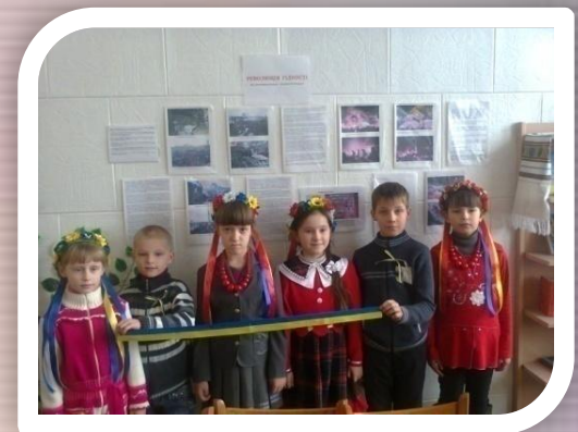
“ Революція Гідності ”