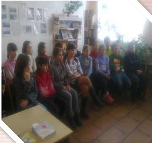
Літературний аукціон “ У світі книг ”