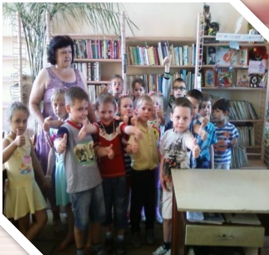
“ Книжкове місто ” Екскурсія майбутніх першокласників