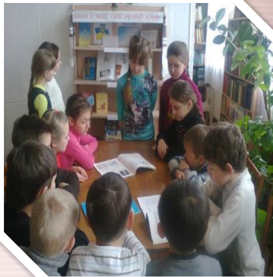
Огляд літератури “ Ми – люди, поки є природа ”