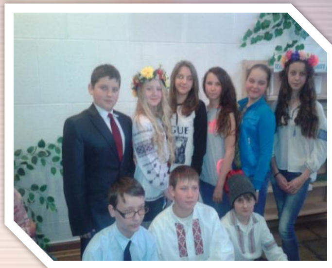
Вих.год. " Таємниця твого козацького ім'я "