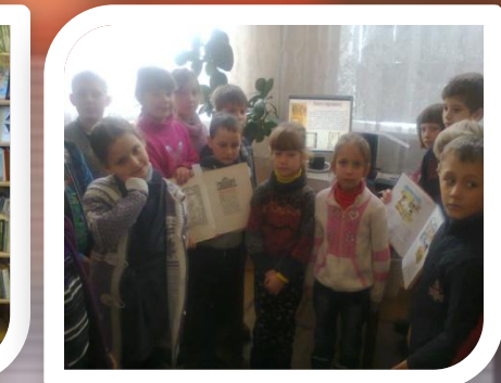
“ Як книга прийшла до нас ”