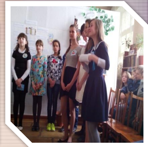
Літературний ринг “Казковими стежками”