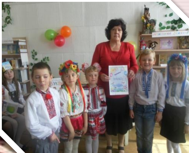
« Свято Букваря»