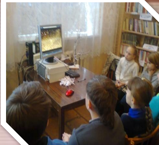
Віртуальна подорож “ Сім див світу ”