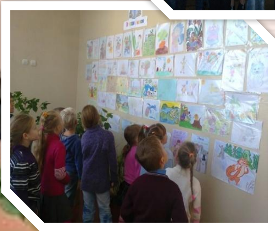
Виставка малюнків “Ми читаємо і маємо”