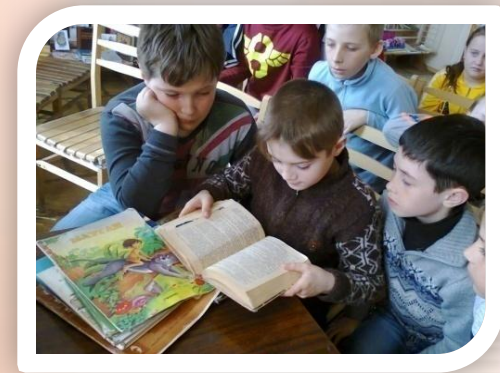
“ Як друкують книги ”