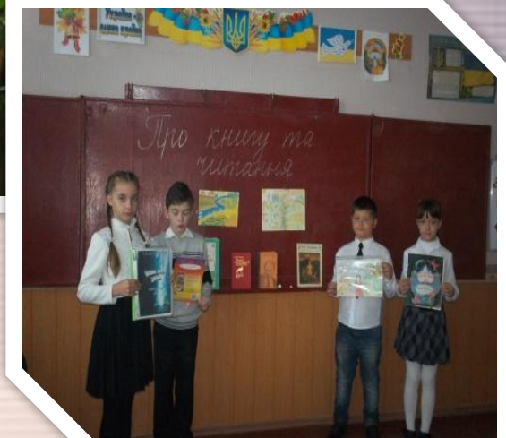
Літ.конкурс “ Моя історія про книгу й читання ”