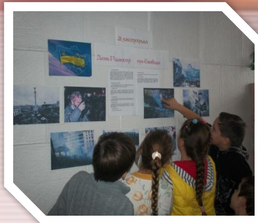
«21 листопада- День Гідності та Свободи»