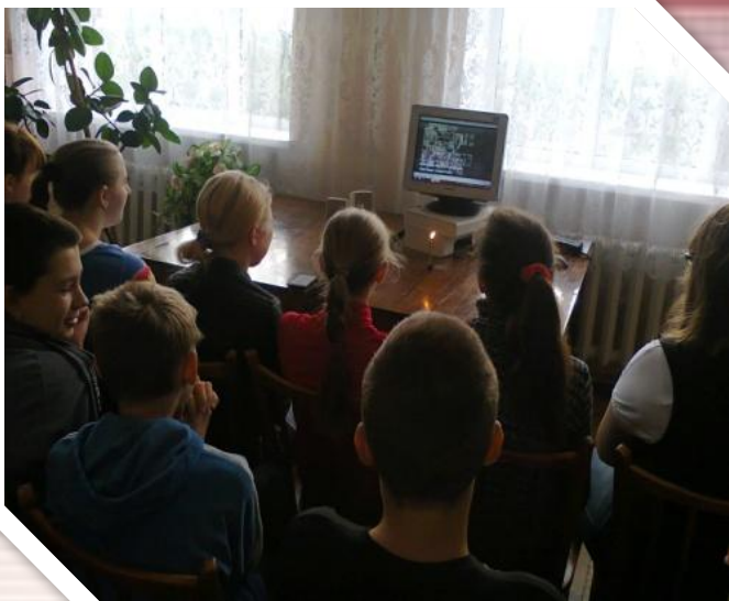
« Бабин Яр. Наша біль. Наша пам'ять»