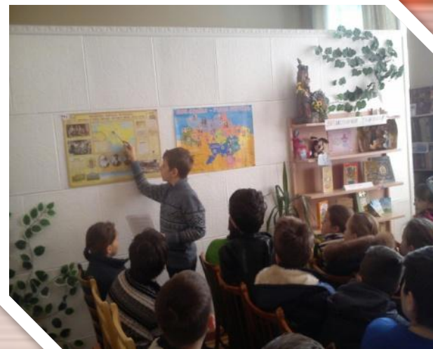
єдиний урок "100 річниця формування Першого українського полку .Б.Хмельницького та початку творення українських збройних сил