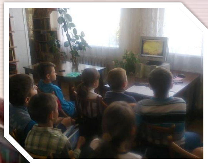
Вих.год." Революція Гідності "