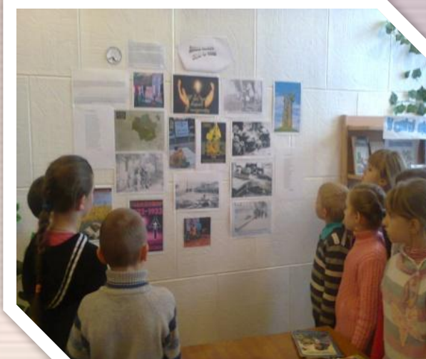
« Допоки пам'ять в серці не згасає» ( пам'яті жертв Голодомору)