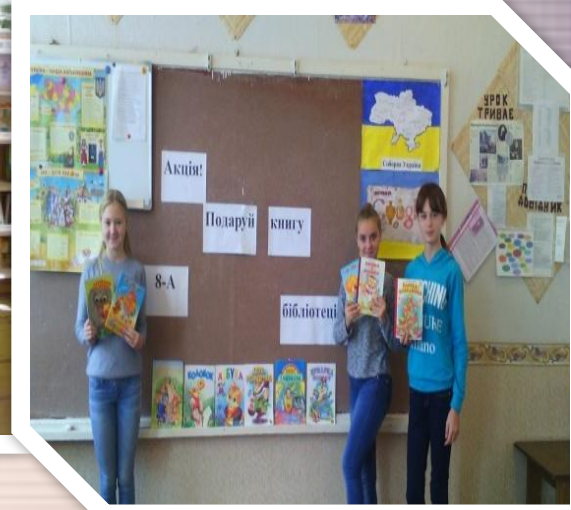
Благодійна акція « Подаруй бібліотеці книгу з власним автографом »