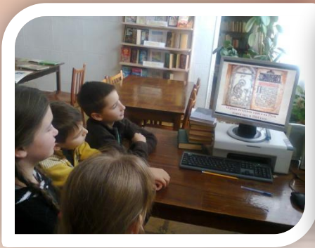
“ З любов'ю до книги ”