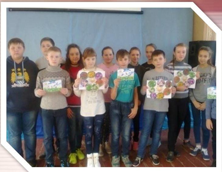
Квест "Здоров'я – це щастя!"