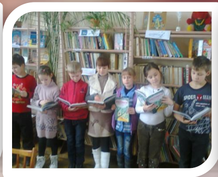
“ До нас завітала книга нова ”