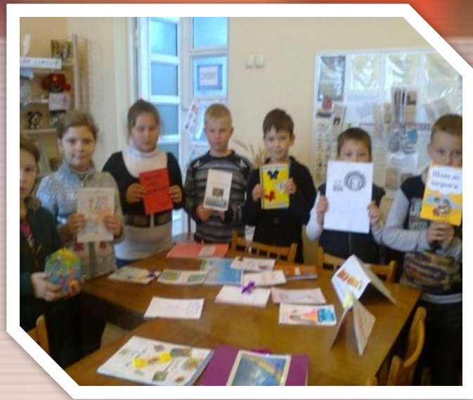
Презентація книжок – саморобок " Шлях до здоров'я "