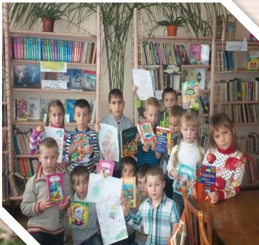
Акція “ Подаруй бібліотеці книгу ”