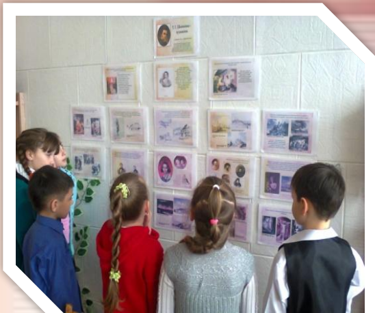
« Т.Г.Шевченко - художник»