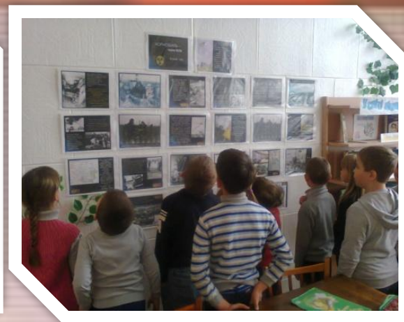
“ Чорнобиль-чорна біль ”