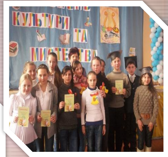
Турнір знавців “ Книгоманія ”