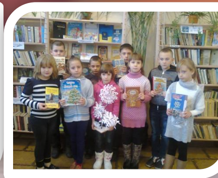
“ Зимові свята українців ”