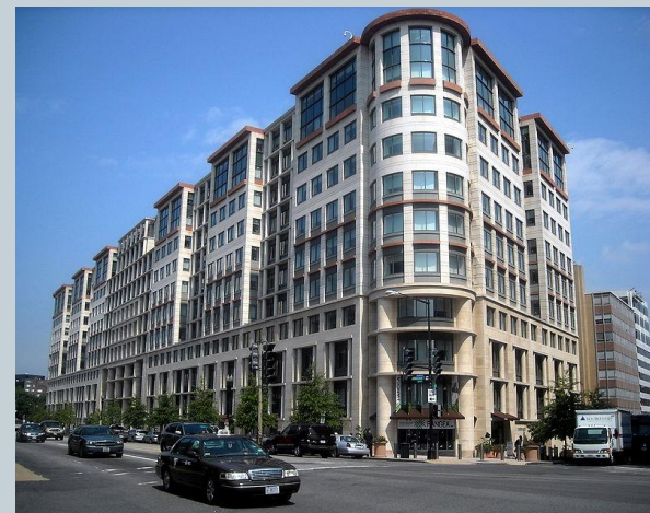
Здание Международной финансовой корпорации в Вашингтоне

IFC осуществляет предоставление займов, инвестирование в форме долевого участия в капитале, предлагает структурированное финансирование и продукты по управлению рисками, а также оказывает консультационные услуги в целях стимулирования роста частного сектора в развивающихся странах. В отличие от МБРР IFC не требует государственных гарантий по предоставляемым средствам.