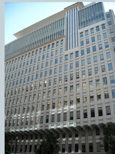
Штаб-квартира группы Всемирного банка в Вашингтоне