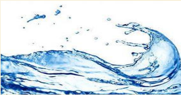
Су күні сәрсенбі (День Воды)