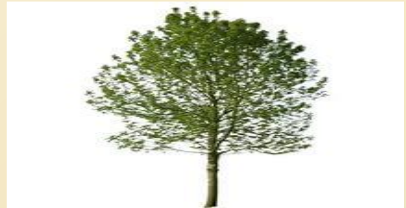
Ағаш күні бейсенбі (День Деревы)