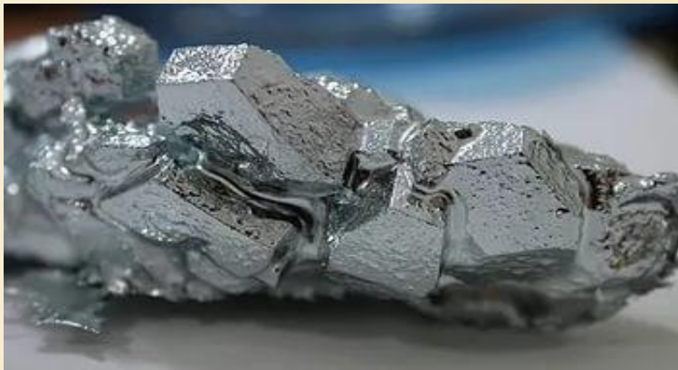
Металл күні жұма (День Металла)