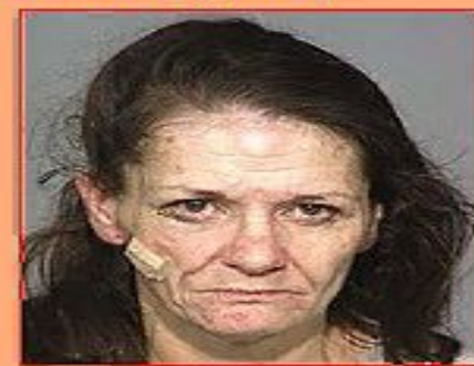
Спустя 3 года 5 месяцев