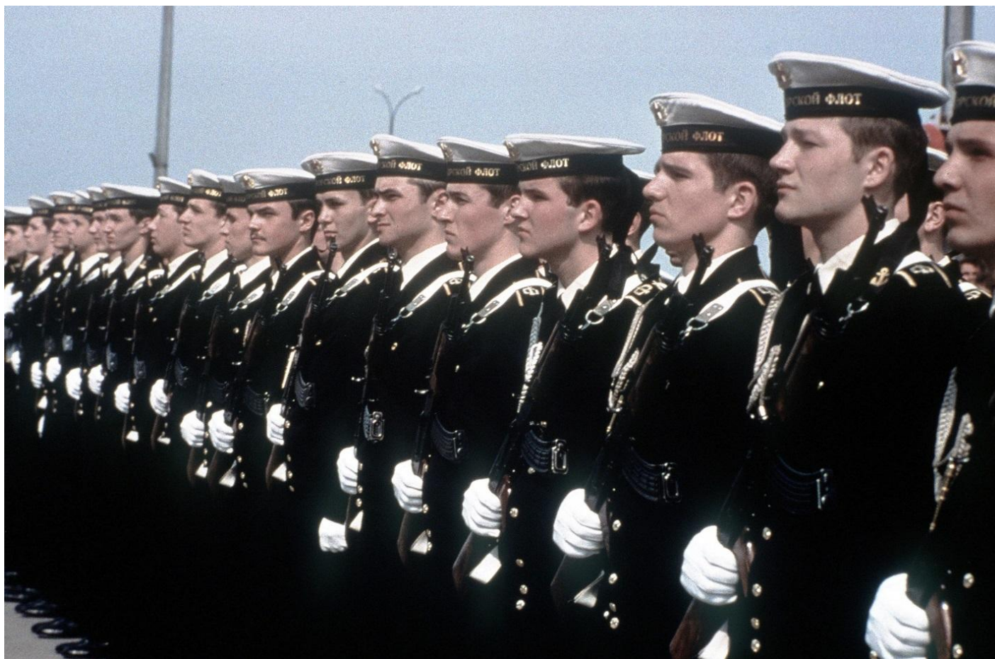
Матросы ВМФ РФ в парадной форме одежды