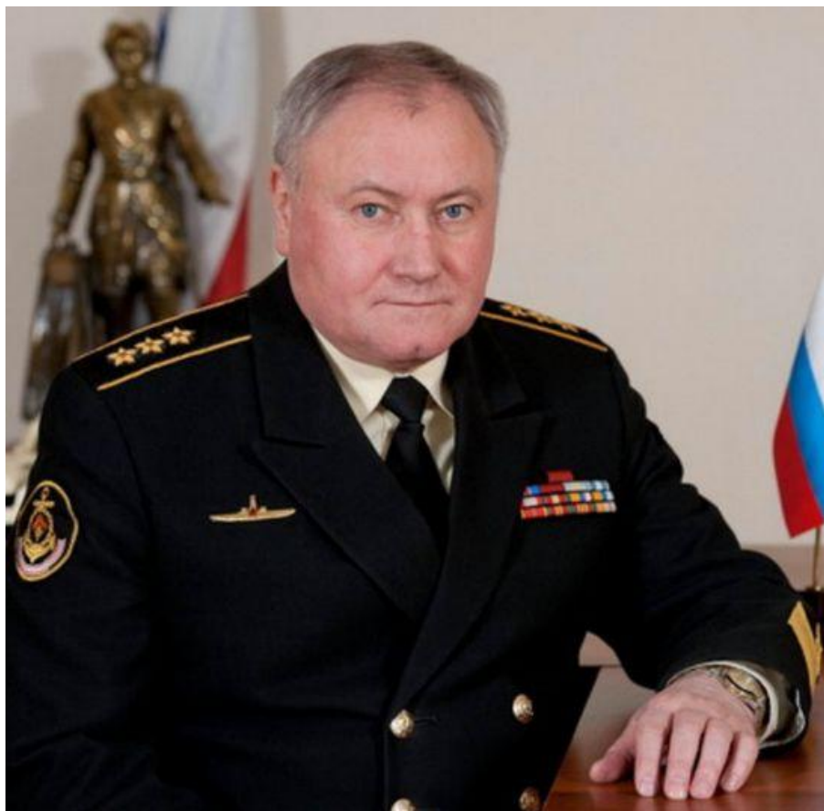
Главнокомандующий Военно-Морским Флотом Российской Федерации — адмирал Королев Владимир Иванович