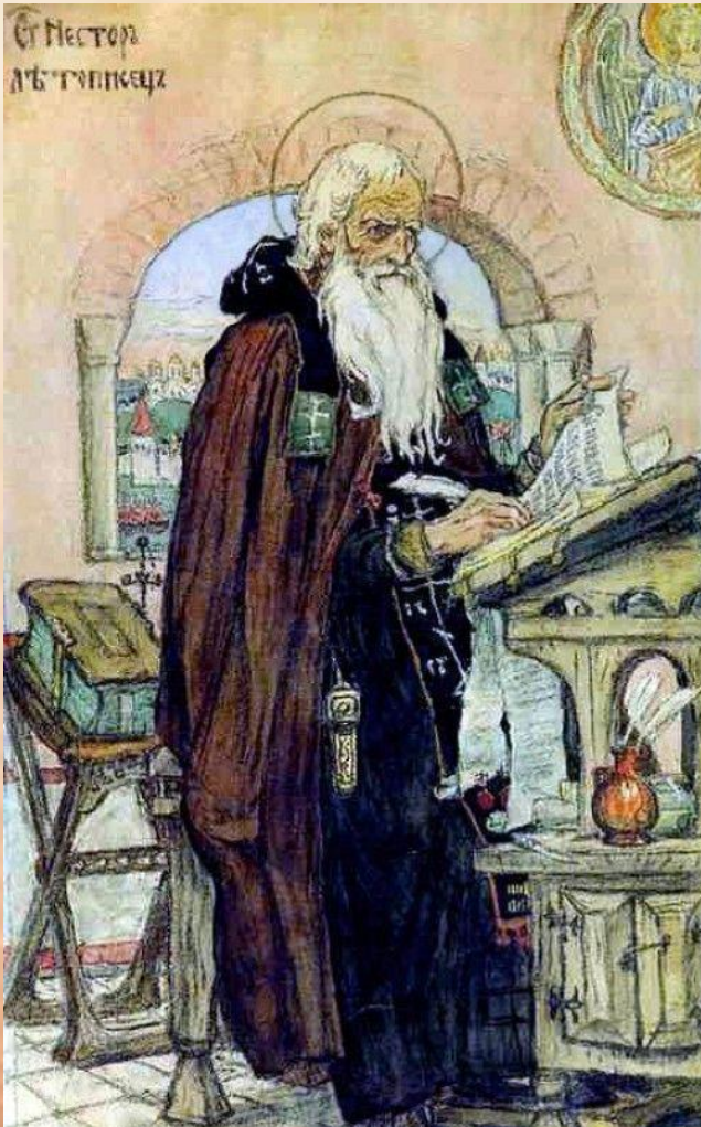
В. Васнецов Нестор-летописец

Раньше, когда хотели отметить особое достоинство какого-либо человека, о нем говорили: «старинный человек».