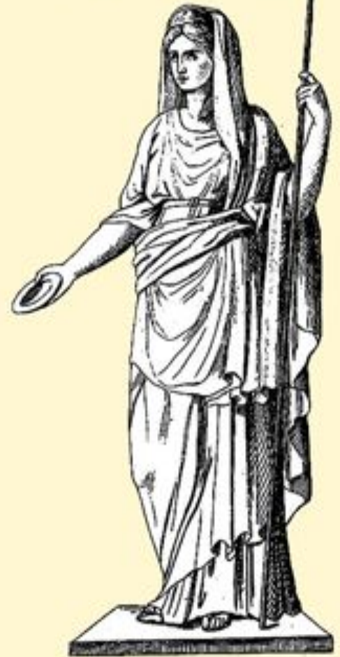
XX. Мнемозина (Страшный суд)

Летописи и придания, книги и партитуры, художественные полотна и храмы- все это создавалось такими «старинными людьми», хранителями памяти истории и культуры человечества. Не случайно именно память, божественная Мнемозина (у греков была богиней мудрости), согласно древнему мифу, стояла у истоков искусства.