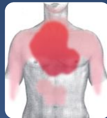
Болевые зоны при инфаркте миокарда