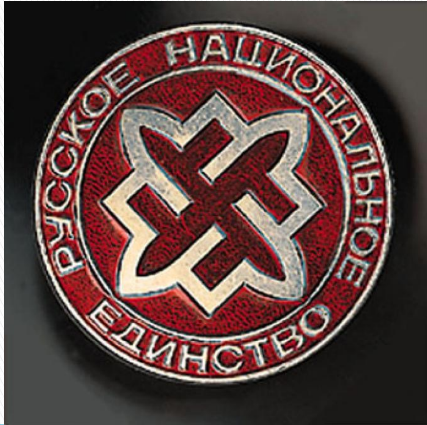
Русское национальное единство