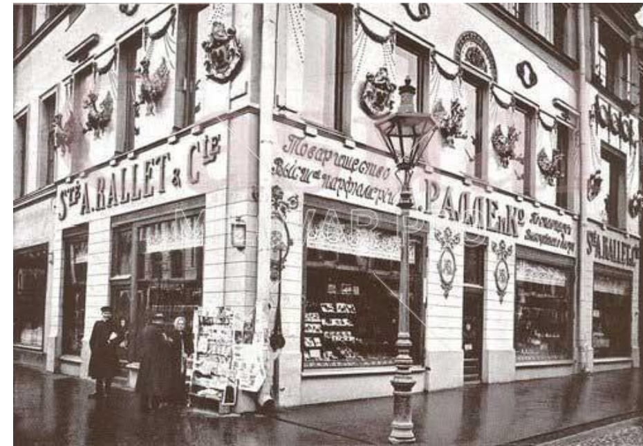
Рис. 3 Первая косметическая линия “Невская косметика” в Санкт-Петербурге в 1840 г.

Русские унаследовали секреты изготовления мыла от Византии, а собственные мыловарни появились в XV веке. В России были целые селения, которые занимались мыловарением. Это дело называлась «поташное ремесло» — по названию вещества «поташ», получаемого из древесной золы. Из поташа и жиров и делалось русское мыло, причем использовался как животное сало, так и растительные масла. [1] Промышленное производство «настоящего» мыла было налажено при Петре I, однако до XIX века оно производилось только для аристократии и считалось дорогой роскошью. Простые люди в качестве очищающего средства использовали полусырой картофель и специальные шарики из папоротниковой золы. [1]