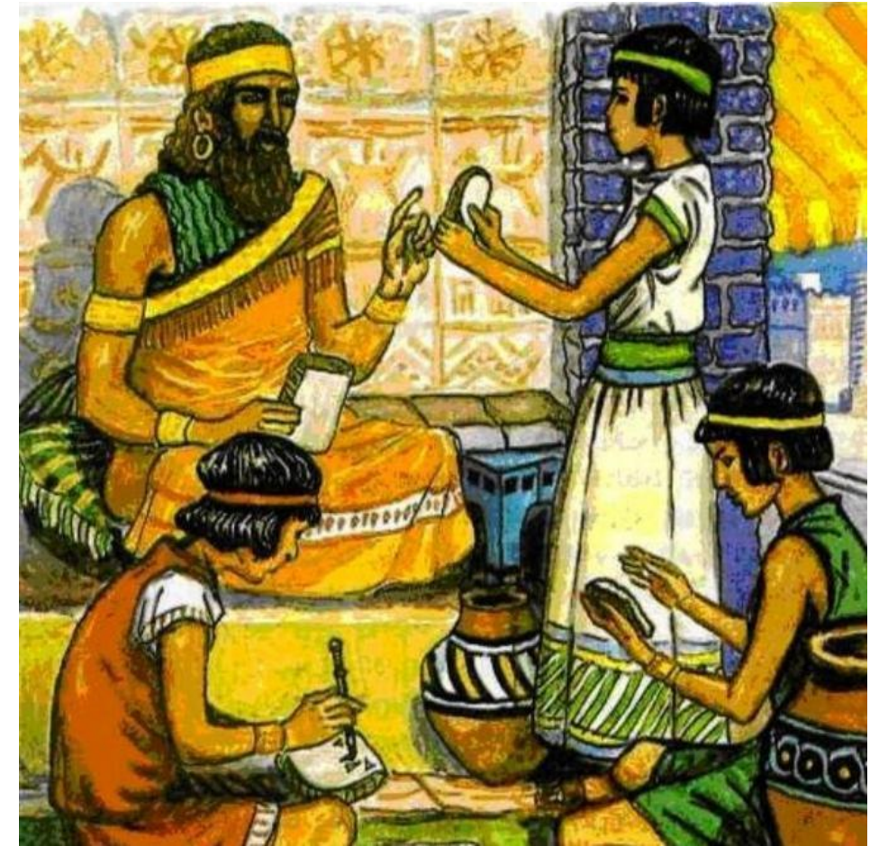
Рис. 1 Приготовление мыла в Древнем Риме

По одной из версий, мыло изобрели в Риме. При раскопках в современной Италии среди руин Помпей археологи нашли настоящие мыловарни. Есть версия, что и само слово «мыло» (на английском языке — soap) образовалось от названия горы Сапон, где древние римляне приносили жертвы богам. Жители Рима приводили на эту гору диких животных, домашний скот, птиц и сжигали их, а боги принимали дары через огонь. Смесь из несгоревших остатков животного жира и древесной золы стекала с глиной в реку Тибр. Женщины, стиравшие там белье, заметили, что с этой смесью грязь отстирывается легче. «Дар богов» стали использовать для стирки одежды и для