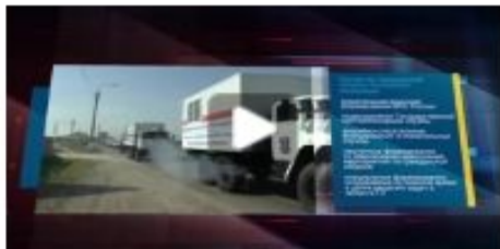
Задачи гражданской обороны