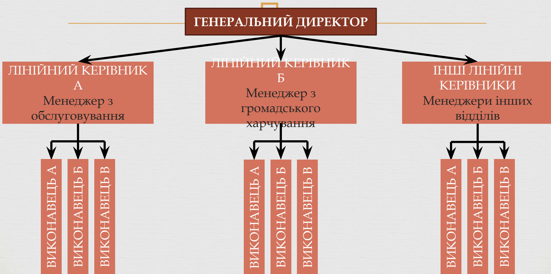
Рисунок 2. Схема лінійного типу організаційної структури управління готельним підприємством