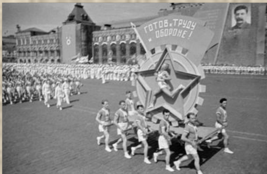
История ГТО в СССР

В 1931 году значкистами ГТО стали 24 тысячи физкультурников, в 1932-м — 465 тысяч и в 1933 году 835 тысяч физкультурников. К весне 1935 года количество значкистов ГТО достигает 1,2 миллионов человек.