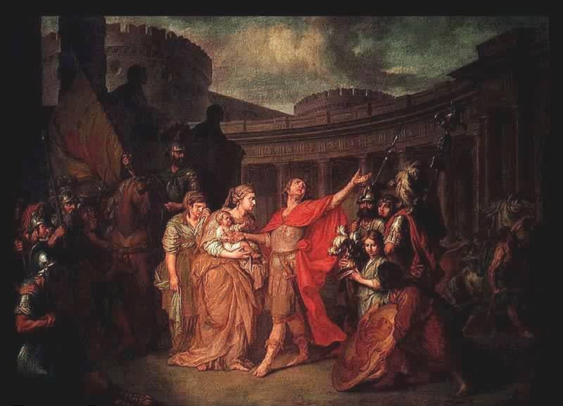
«Прощание Гектора с Андромахой»