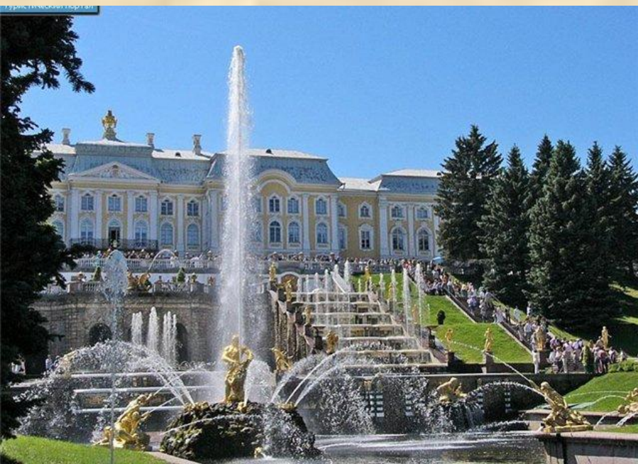
Петергоф. Большой дворец