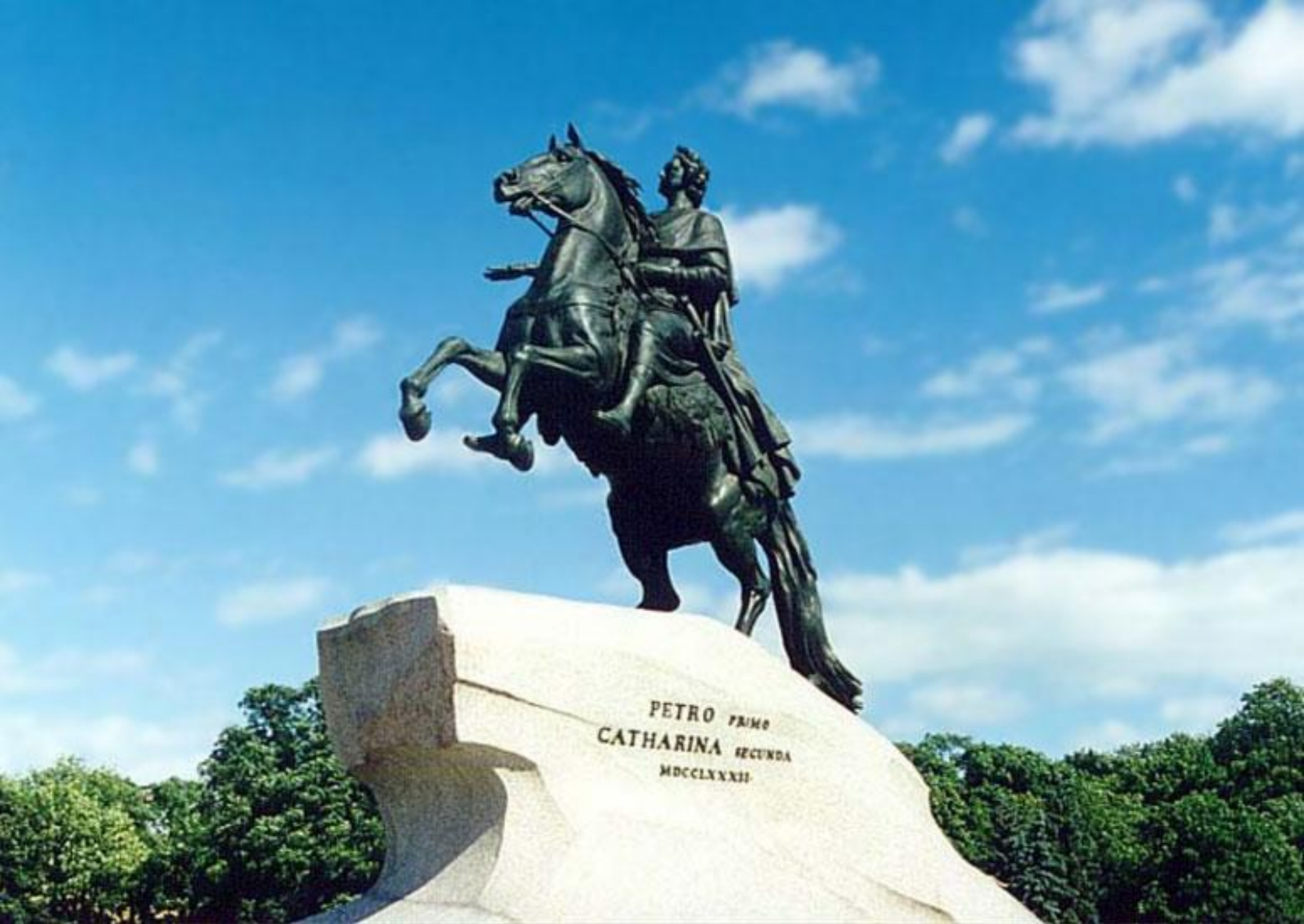
Этьен Фальконе. Памятник Петру I