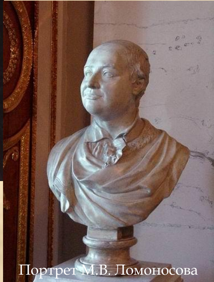
Портрет М.В. Ломоносова