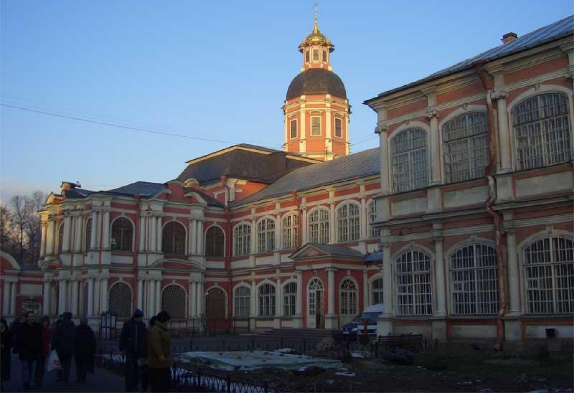
Александро – Невская лавра. Петербург.