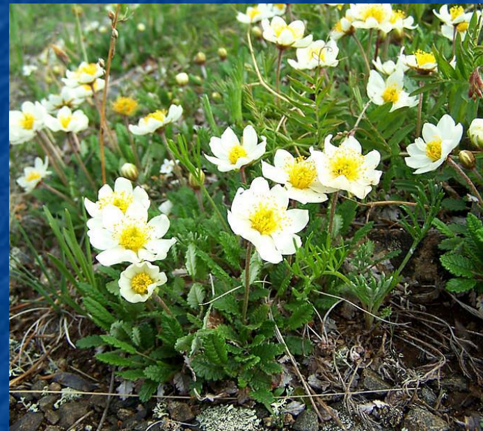
КУРОПАТОЧЬЯ ТРАВА (ДРИАДА)