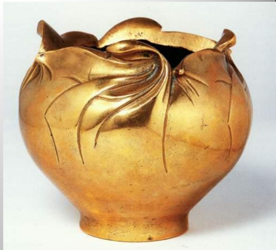
Ваза, позолоченная бронза