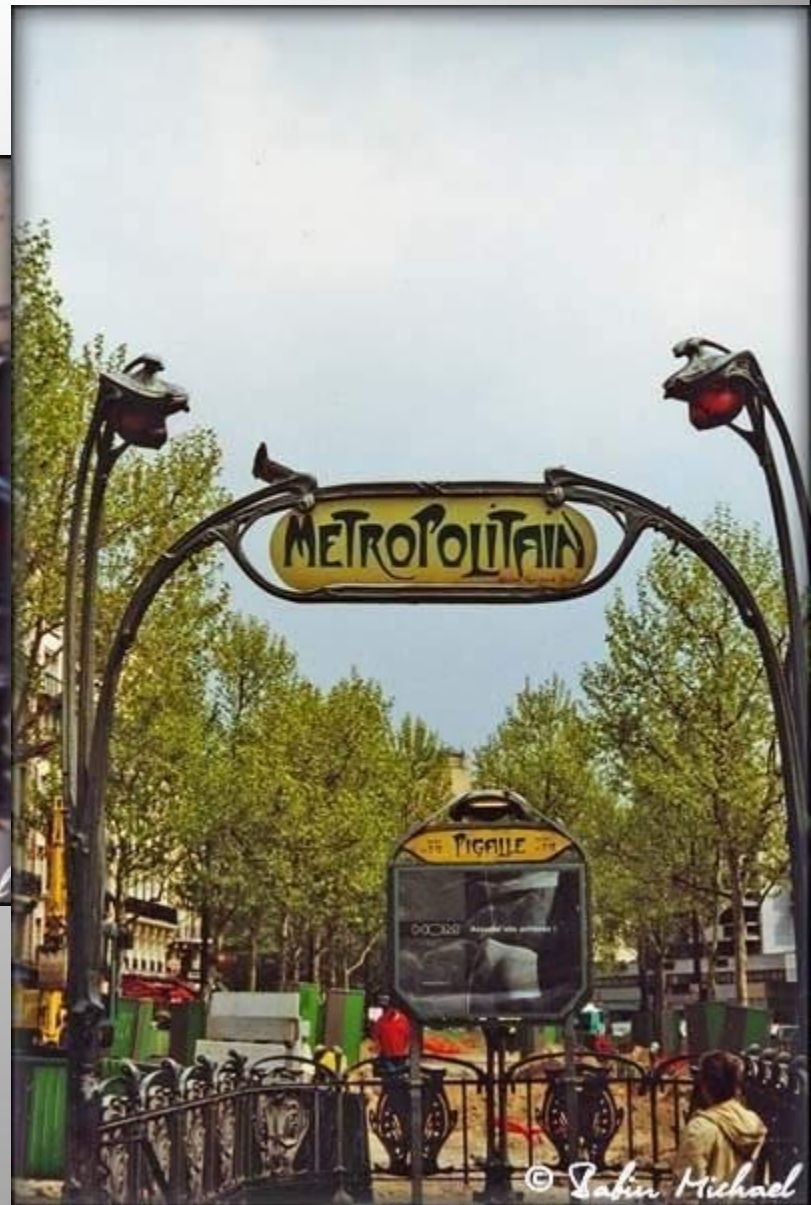
Эктор Гимар. Станция метро в Париже.