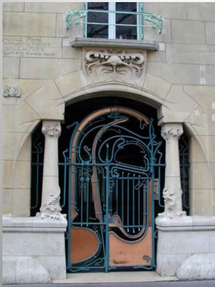
Париж. Ворота отеля Кастель Беранже, архитектор Гектор Гимар