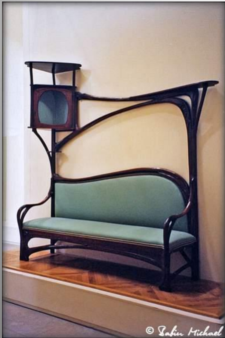
Гектор Гимар - Диван для курительной, 1897 год. Музей Д'Орсе.