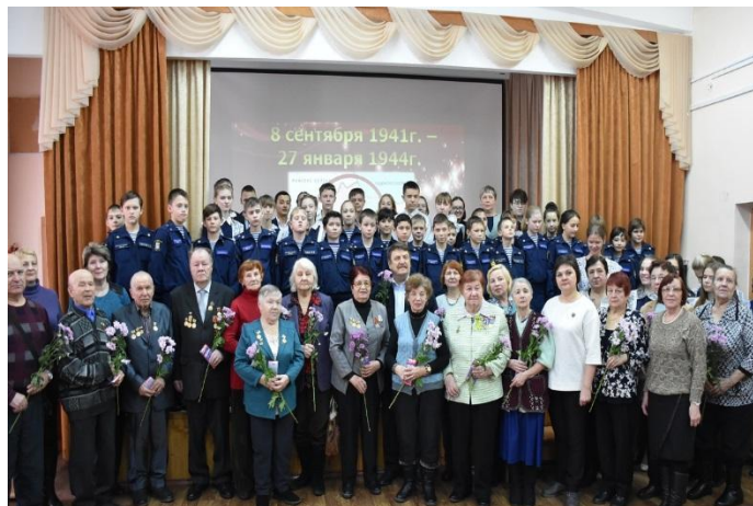
Проект «Пусть молодое поколение свякую память не предаст»