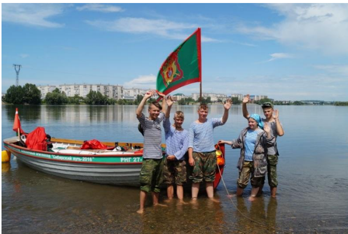
Молодёжный шлюпочный агитпоход «Эстафета Подвига»