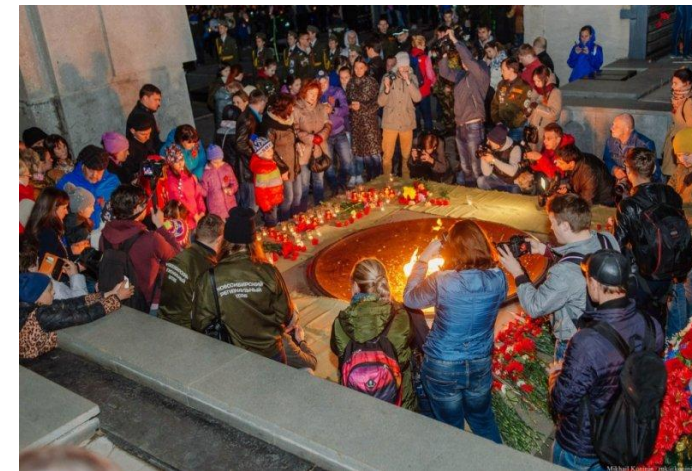
Гражданская Акция «Свеча Памяти»