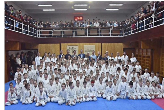
«Наследники Победы» - Всероссийский турнир, посвященный 75-летию Победы