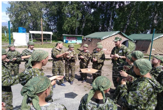
Программа «Наследие героев»