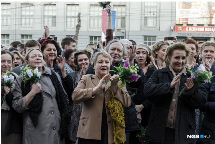
Патриотическая акция «И город узнал о Победе»