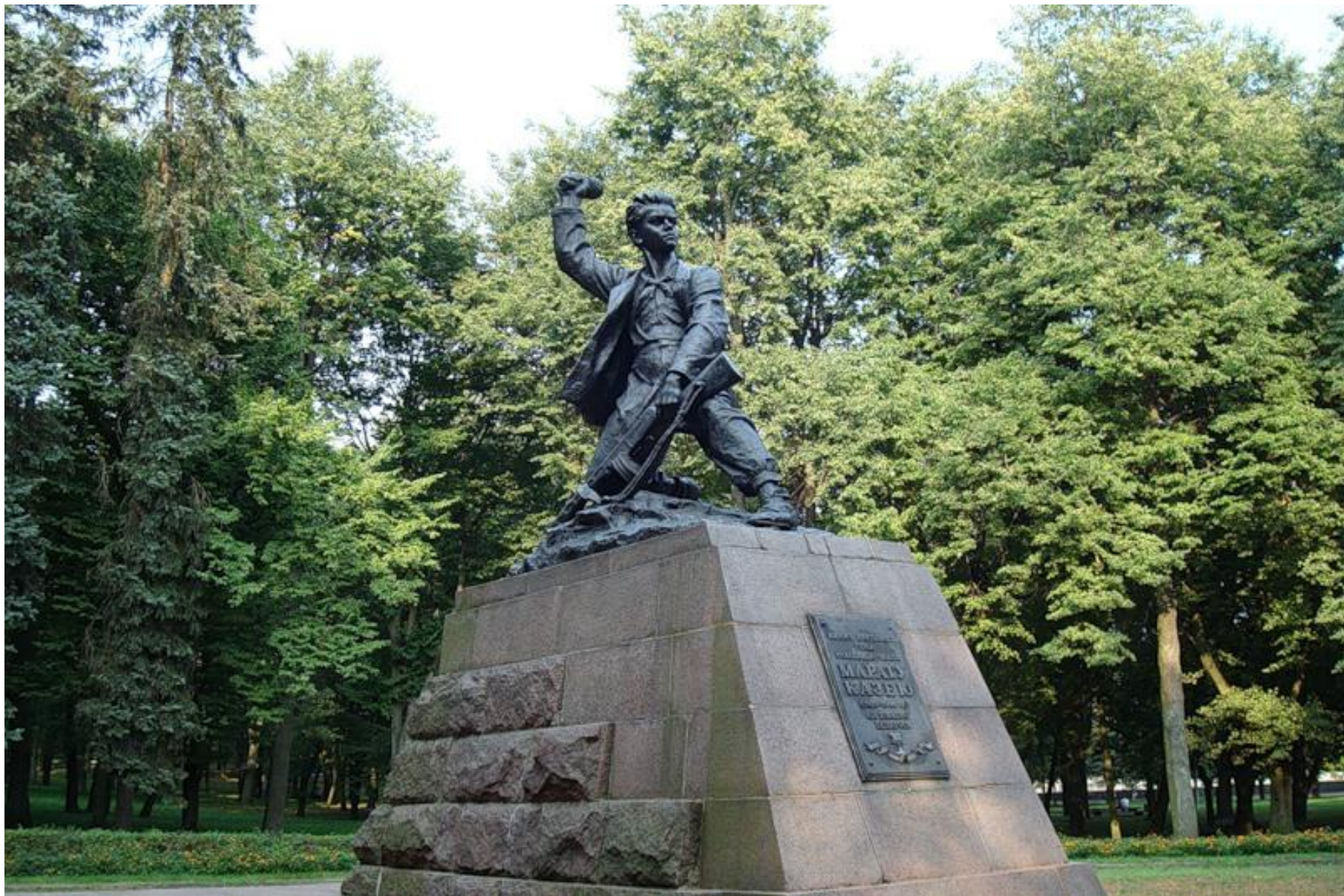
Памятник Марату Казею